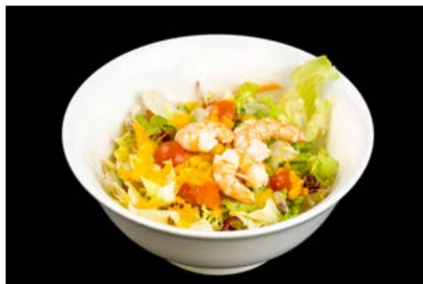
8. Ebi salad € 7 INSALATA CON GAMBERI E SALSA CHEF (2-6-10)*