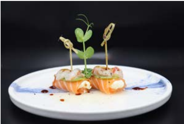
625. Basil roll € 12 2pz SALMONE, PHILADELPHIA, GAMBERO DOLCE, BASILICO, SALE, PEPE E OLIO D'OLIVA (2-4)*