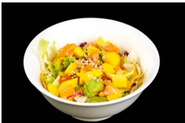
9. Zen salad € 9 INSALATA CON SALMONE AVOCADO E MANGO (2-4-10)