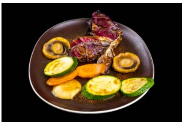
270. Verdure alla piastra € 5 (15)