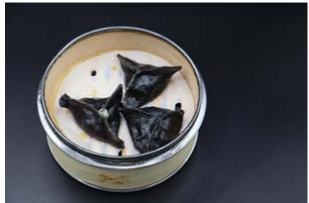
59. Suzuki Gyoza € 6 RAVIOLI DI PESCE BIANCO (1-4-6)*