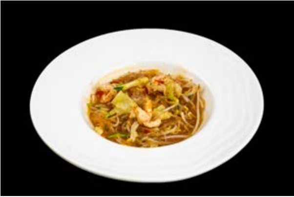
234. Spaghetti di soia piccanti € 8 (2-6)*