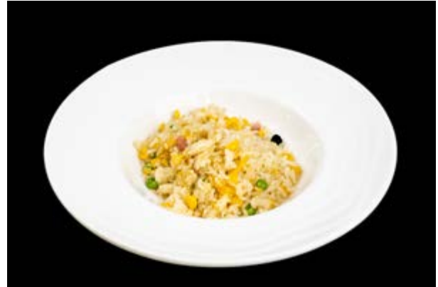
211. Riso cantonese € 8 UOVA, PISELLI, MAIS, PROSCIUTTO COTTO (3-6)*