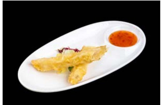
243. Samurai stick € 5 INVOLTINI CON PESCE E GAMBERI (1-2-3-4)*