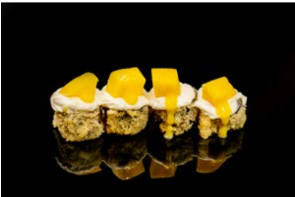
190. Sake maki mango € 10 4pz SALMONE PHILADELPHIA MANGO (4-7)