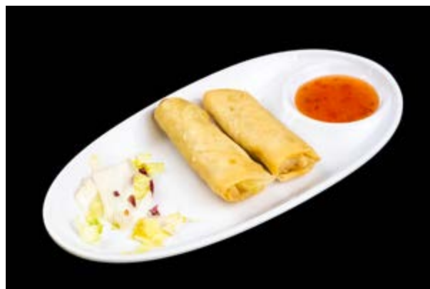
14. Harumaki sake € 3 SALMONE, SALSA PICCANTE ,CIPOLLA (1-4-16)*