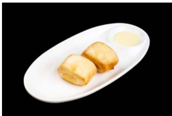
65. Bao fritto € 3 (1-7-15)*