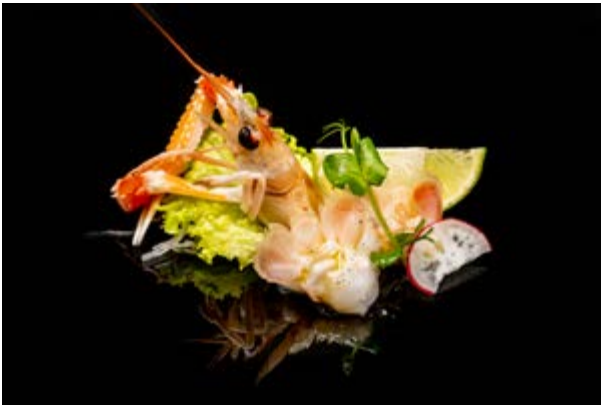
612. Scampi € 7 (2)*