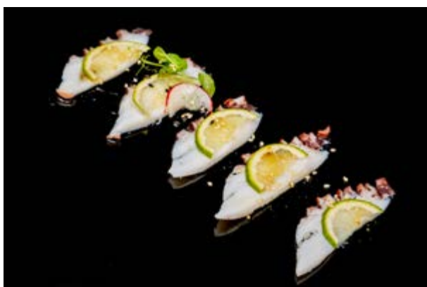
74. Carpaccio di polipo € 12 POLIPO SOTTILE E LIME CON SALSA (6)*