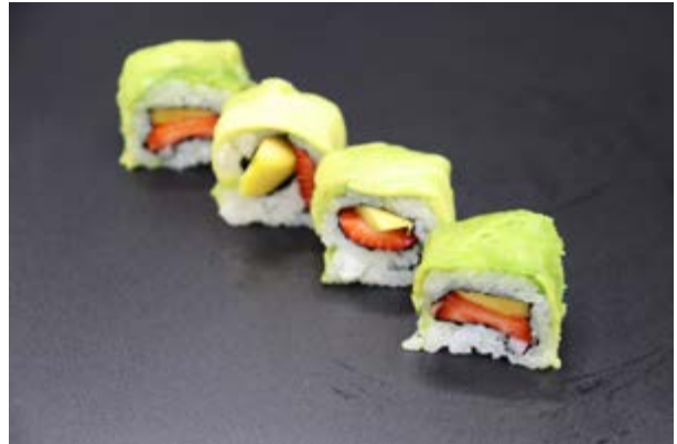
155. Redsummer € 12 4pz RISO, ALGA NORI, PHILADELPHIA, MANGO, FRAGOLA, ALL'ESTERNO AVOCADO E SCAGLIE DI COCCO (7)