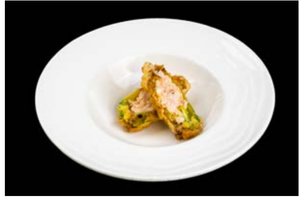
247. Hana ebi € 6 FIORE DI ZUCCA RIPIENO CON GAMBERO (1-2-3)*