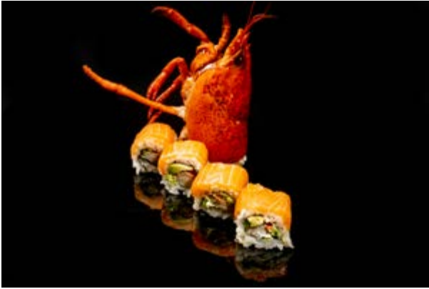
600. Astice Roll € 20 4pz ASTICE, AVOCADO, MAIONESE, SALMONE (2,3)*