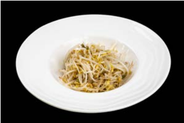
298. Germogli di soia € 5 (15)