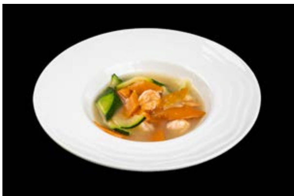
290. Gamberi con verdure € 8 (2)*