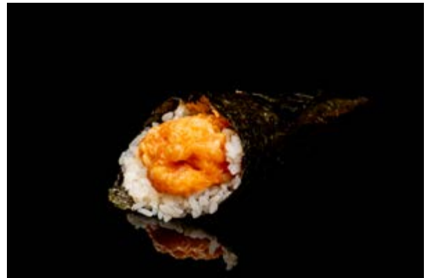
201. Temaki spicy salmone € 5 TARTARA DI SALMONE SPICY (3-4)