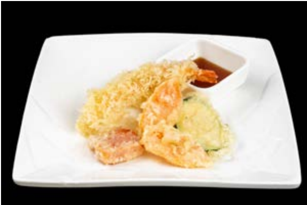
242. Tempura mix € 10 TEMPURA GAMBERI E VERDURE (3-6)*