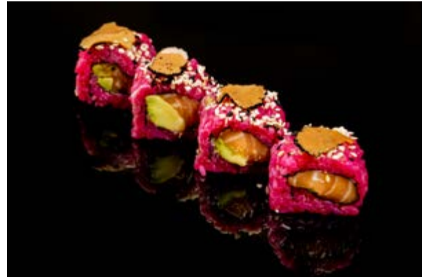
174. Truffle rosato € 14 4pz SALMONE AVOCADO PHILADELPHIA , TARTUFO, SESAMO (4-7-11)