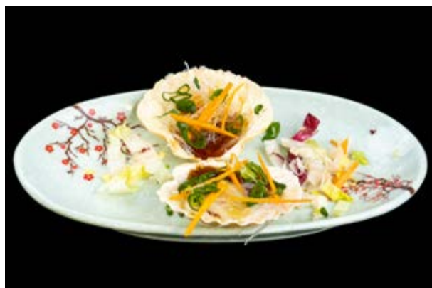
295. Capesante al vapore € 12 ( massimo 1 volta a persona ) CAPESANTE AL VAPORE CON SALSA DI SOIA E ACETO, ERBA CIPOLLINA (1-6-14)