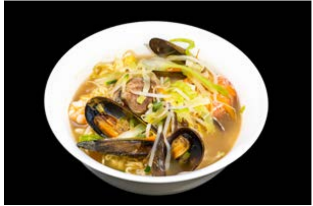
223. Ramen in zuppa con frutti di mare € 12 (2-14)