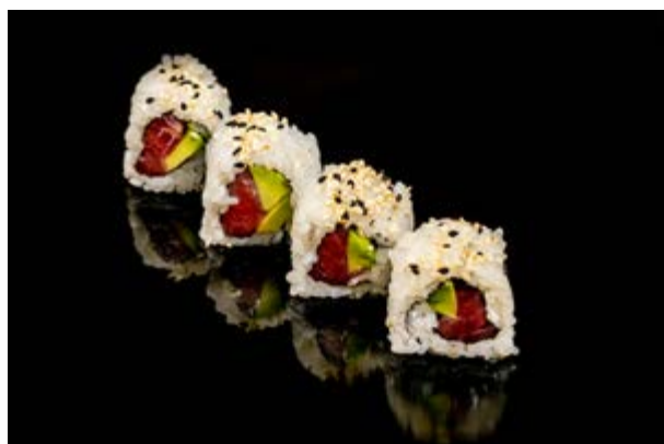
131. Tuna roll € 9 4pz TONNO AVOCADO, SESAMO (4-11)