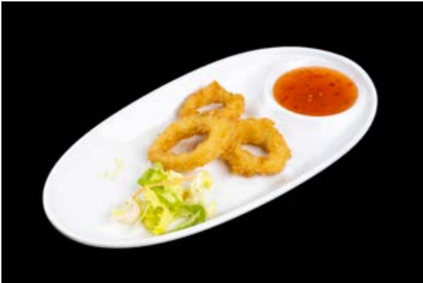
248. Ika furai € 7 CALAMARI FRITTI (1-3-14)*