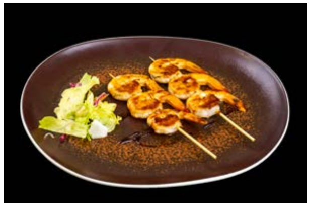
265. Yakitori ebi € 10 GAMBERI E TERIYAKI (2-6)*