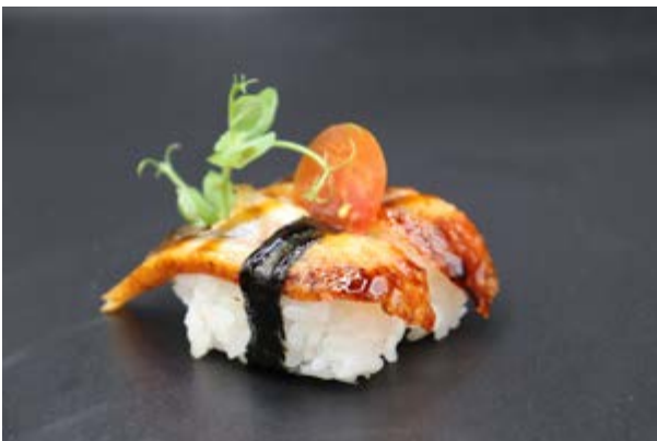
110. Nigiri anguilla € 4 ANGUILLA, SALSA TERIYAKI (4-11)*