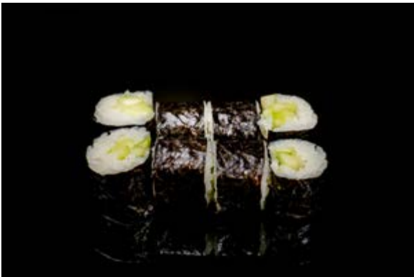
182. Kappa maki € 4 8pz CETRIOLI (15)