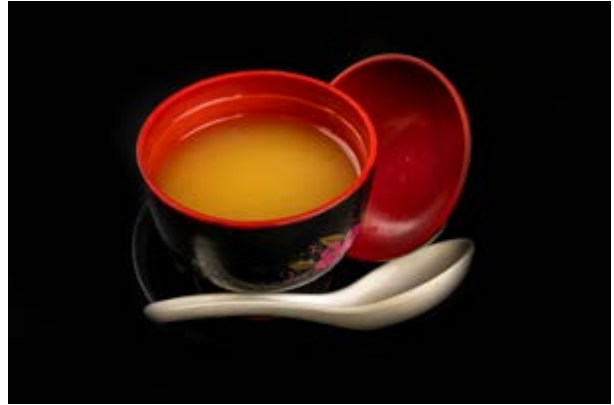
31. Zuppa di miso € 3 ZUPPA CON ALGHE , TOFU E MISO (3)