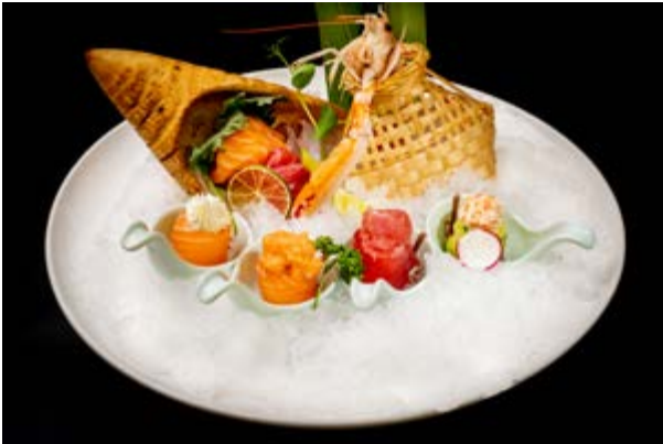
96. Gunkan e sashimi misto € 20 7 sashimi, 1 scampo, 4 gunkan mix (2-4-7)