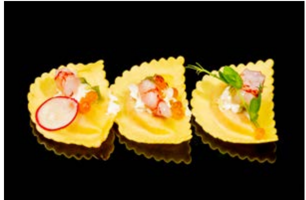
615. Metà luna di salmone € 10 2pz Mezzelune di salmone con gamberi rossi, PHILADELPHIA, IKURA, WASABI FRESCO (1-2-4)*