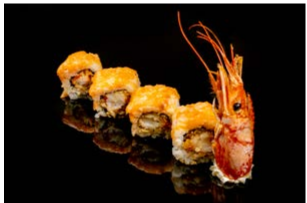
605. King prawn roll € 14 4pz GAMBERONI KADAIFI , TARTARA DI SALMONE , TERIYAKI , BRICIOLE DI TEMPURA (1-2-3-4-6)*