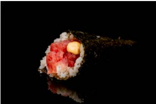
200. Temaki spicy tuna € 5 TARTARA DI TONNO SPICY (3-4)