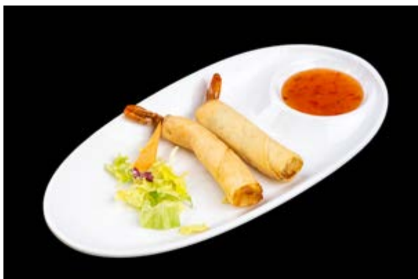
13. Harumaki € 4 GAMBERI , ZUCCHINE , CAROTE (1-2)*