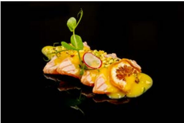
620. Sashimi scottato € 12 SALMONE SCOTTATO CON SALSA MANGO E PISTACCHIO (4-8)