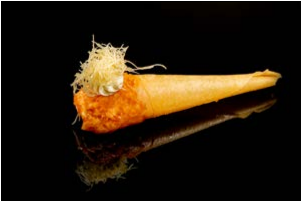
194. Cono salmone € 5 SALMONE PHILADELPHIA KADAIFI (1- 4-7)