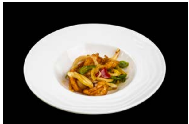
289. Gamberi sale e pepe € 8 (2)*