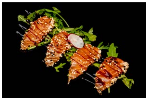
75. Sake Tataki € 10 SALMONE SCOTTATO IN CROSTA DI SESAMO (4-6-11)