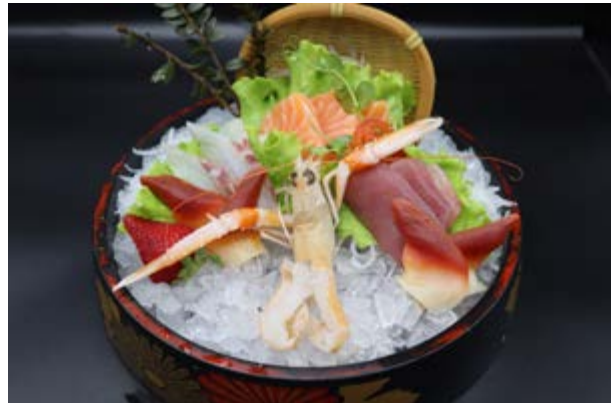
91. Sashimi misto € 15 SALMONE, TONNO, BRANZINO, SCAMPO, FOSOLARO HOKKIGAI (4)