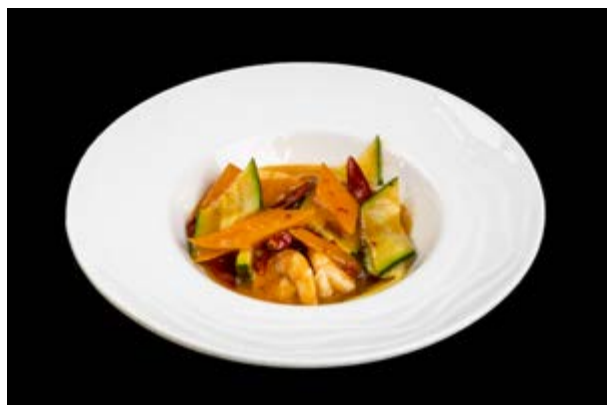
291. Gamberi in salsa piccante € 8 (2-6)*