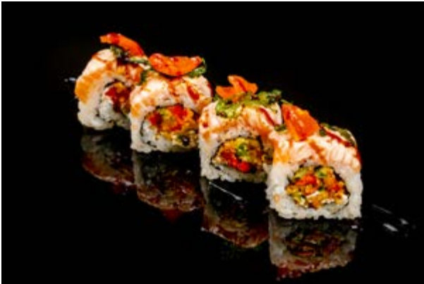
160. Uramaki queem € 12 4pz TEMPURA DI VERDURE MISTE , PHILADELPHIA ,SALMONE SCOTTATO, POMODORINI , TERIYAKI , RUCOLA FRITTA (1-4-6-7)