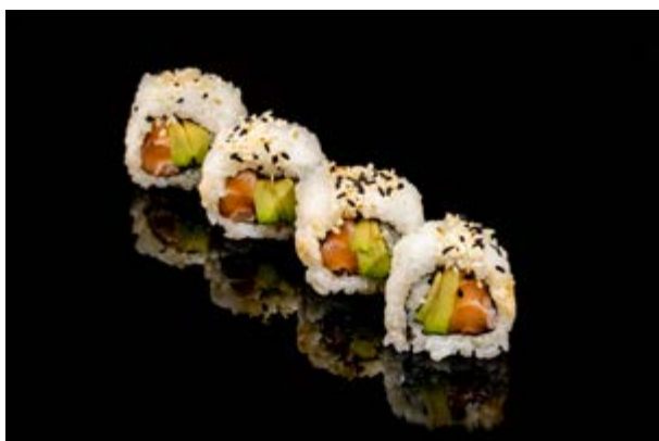
130. Salmone roll € 8 4pz SALMONE AVOCADO, SESAMO (4-11)