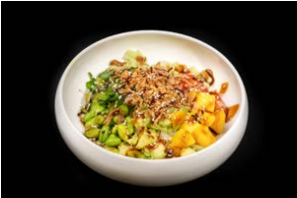
42. Pokè vegetariano € 10 RISO , AVOCADO, EDAMAME, WAKAME, MANGO, POMODORO, CIPOLLA FRITTA (15)