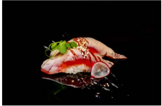
107. Nigiri maguro burn € 4 TONNO, SALSA TERIYAKI, SESAMO (4- 6-11)