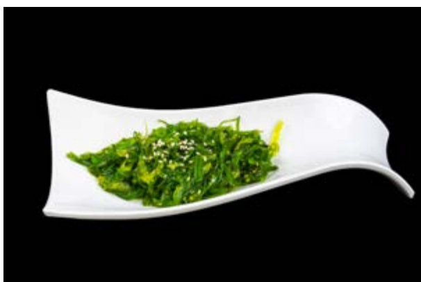
5. Wakame salad € 3*