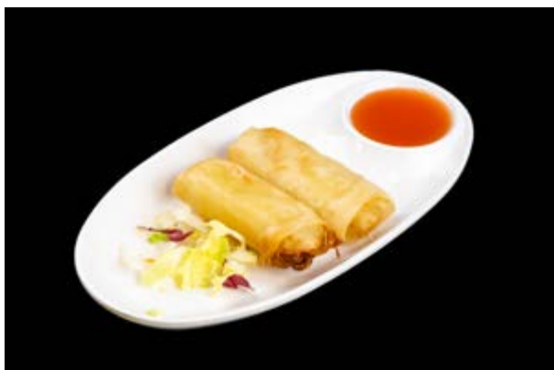
16. Involtini primavera € 3 CAROTE, CAPPUCCIO BIANCO, CIPOLLA (1-15)*