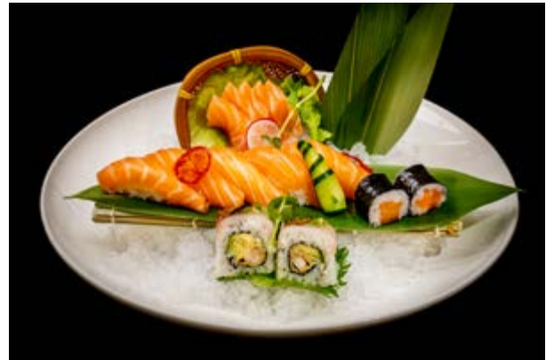
95. Susa salmone € 15 4 sashimi, 5 nigiri, 2 uramaki, 2 hossomaki (4)