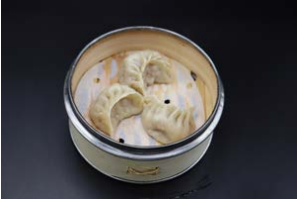
56. Gyoza di carne € 5 RAVIOLI DI CARNE (1-3-6)*