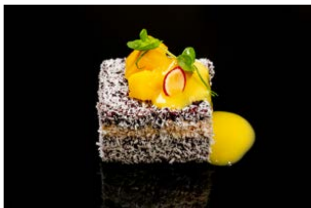
609. Onigiri Fruit € 8 RISO VENERE, SALMONE COTTO, POLVERE DI COCCO, MANGO E SALSA MANGO (1-4-7)