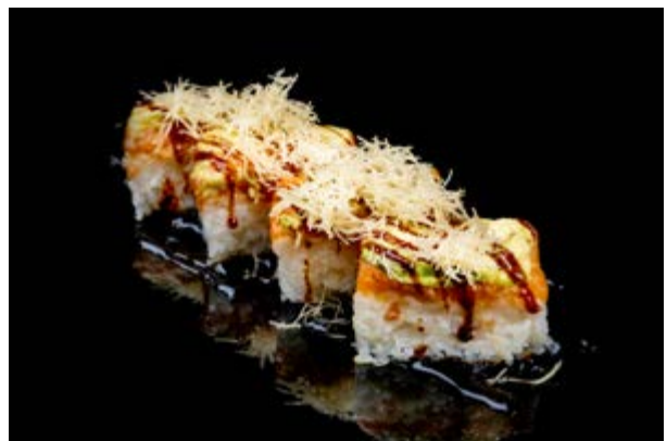
157. Saudate € 10 4pz SALMONE , AVOCADO , KADAIFI , TERIYAKI , SENZA ALGA (1-4-6)