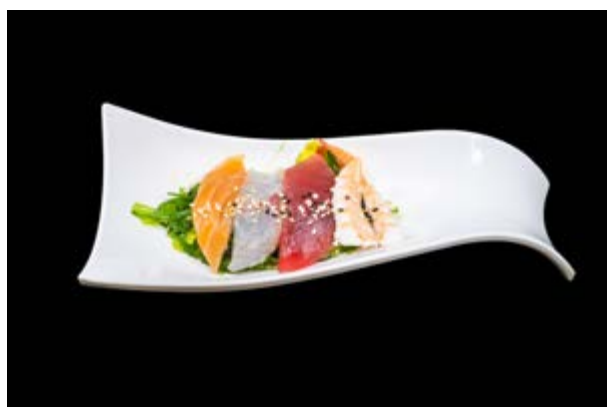
6. Sunomono € 6 ALGHE CON PESCE MISTO (2-4-11)*