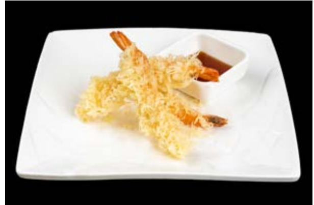
241. Ebi tempura € 10 TEMPURA DI GAMBERI (1-2-3)*