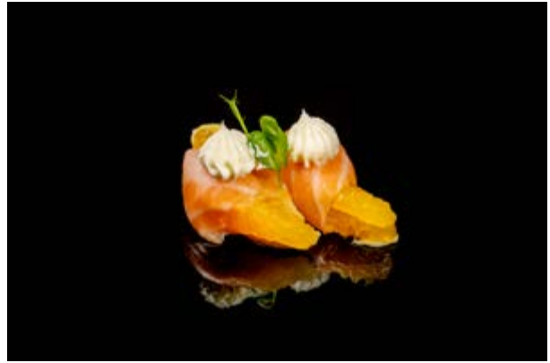
122. Orange sake € 6 SALMONE, ARANCIA, PHILADELPHIA, (4-7)