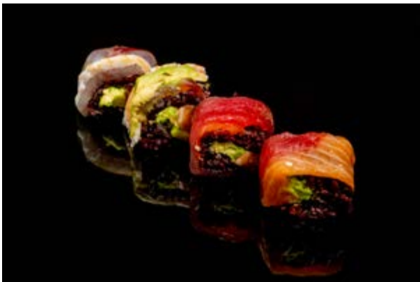
168. Rainbow venus € 12 4pz PESCE MISTO E AVOCADO (2-4)