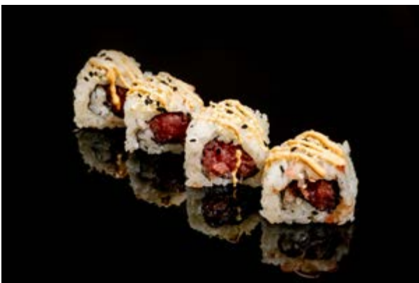
138. Spicy tuna roll € 10 4pz TARTARA DI TONNO SPICY, SESAMO, SALSA SPICY MAYO (3-4-11)