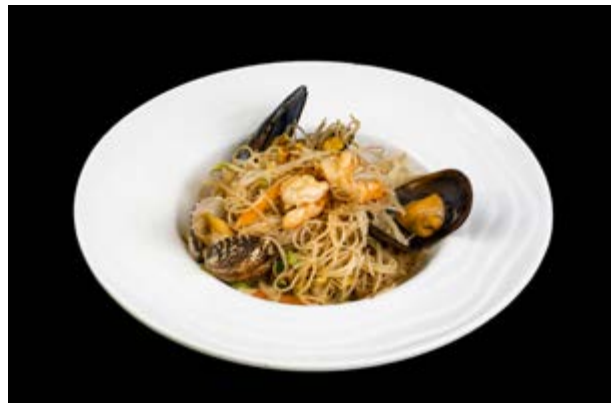
227. Spaghetti di riso con frutti di mare € 9 (2-3-6-14)*