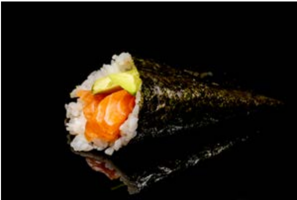
198. Temaki salmone avocado € 5 SALMONE AVOCADO (4)