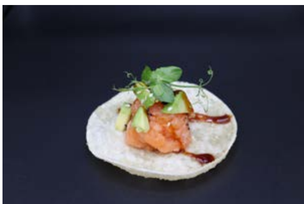
23. Zen Fried sake € 7 1pz FOGLIE DI INVOLTINO, AVOCADO, TARTARE DI SALMONE, TERIYAKI (1-3- 4-7)