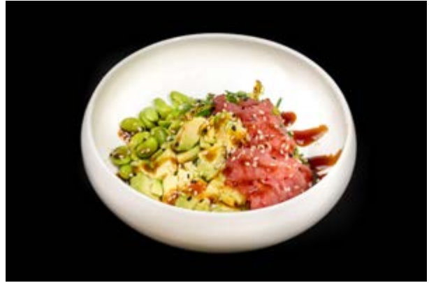
41. Pokè Tonno € 12 RISO TONNO , AVOCADO , EDAMAME , MANGO (4)