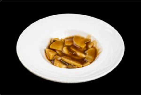
296. Bambù e funghi € 5 (15)