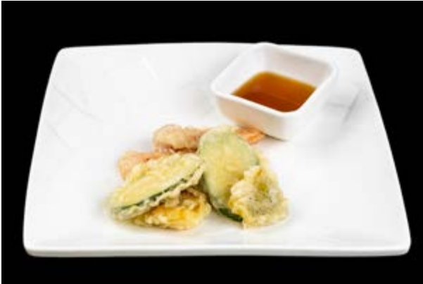
240. Yasay tempura € 6 TEMPURA DI VERDURE (1-3-15)