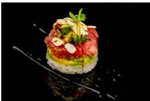
80. Chirashi di tonno € 12 TORTINO DI RISO CON TARTARA DI TONNO, AVOCADO, TERIYAKI, MANDORLE (4-6-8)