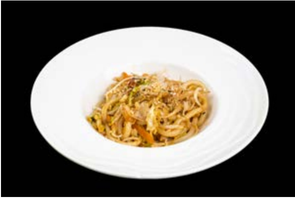
228. Udon con verdure € 7 ARACHIDI, SESAMO, TONKATSU SAUCE (8-11-15)