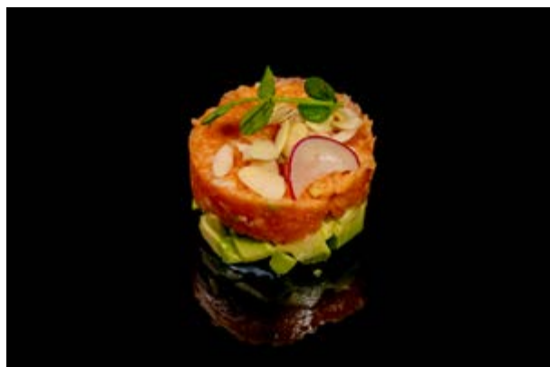
77. Tartare di salmone € 9 SALMONE , MANDORLE A SCAGLIE , AVOCADO E SALSA FRUTTO DELLA PASSIONE (4-8)