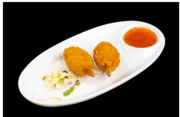
245. Chele di granchio € 5 (1-2)*