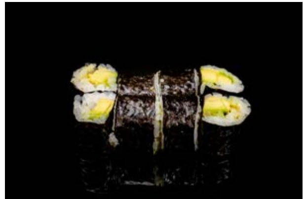
183. Avocado maki € 4 8pz AVOCADO (15)