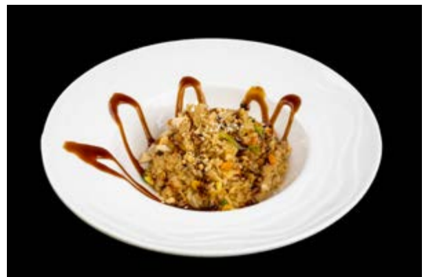
215. Riso con pollo e verdure € 8 RISO, POLLO, VERDURE, SESAMO, ARACHIDI, SALSA MISO, TERIYAKI (3-6- 8-11)*