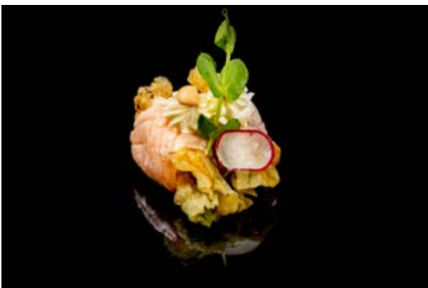
123. Salmone flower € 6 FIORE DI ZUCCA IN TEMPURA, SALMONE SCOTTATO, PHILADELPHIA, SALSA SPICY MAYO (1-3-4)