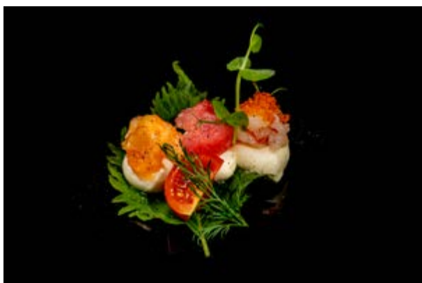
608. Tris di ciliegine € 10 PESCE MISTO, MOZZARELLA, SALE E PEPE (4-2-7)*