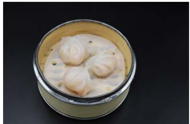
61. Ebi Gyoza € 6 RAVIOLI DI GAMBERI (1-2-6)*