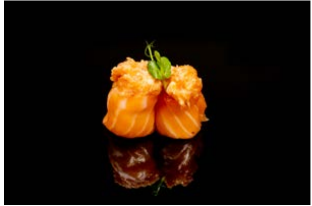
120. Gunkan salmone out € 5 (4)