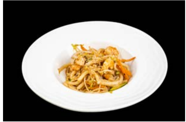
229. Yaki udon € 9 ARACHIDI, SESAMO, TONKATSU SAUCE (2-6-8-11)*