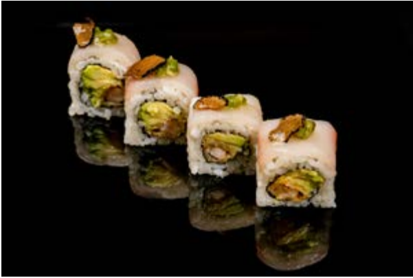
152. Ricciola e tartufo € 14 4pz GAMBERO IN TEMPURA , MAIONESE , AVOCADO ,RICCIOLA ,WASABI E TARTUFO, TERIYAKI (1-2-3-4)*