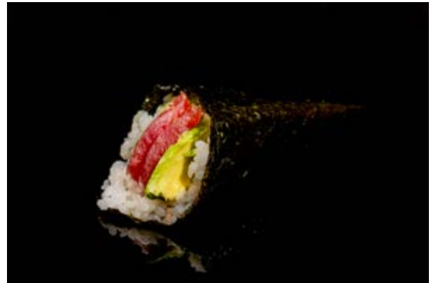
199. Temaki tonno avocado € 5 TONNO AVOCADO (4)