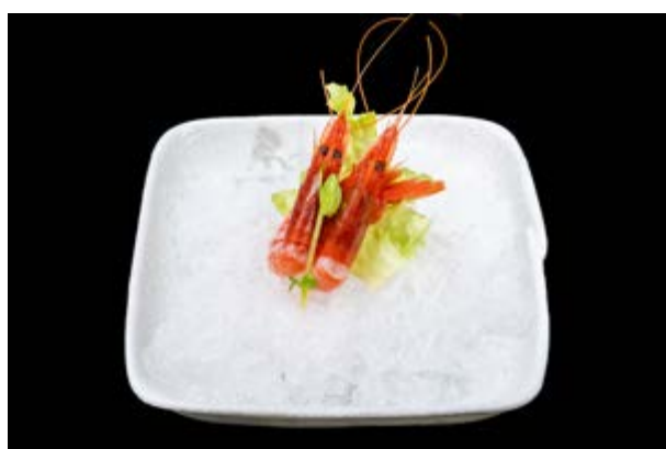
611. Gamberi rossi € 6 (2)*