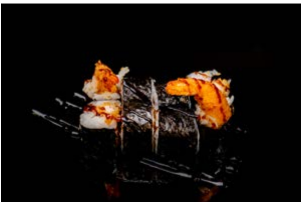
184. Ebiten Maki € 4 8pz GAMBERO IN TEMPURA E TERIYAKI (1-2-6)*