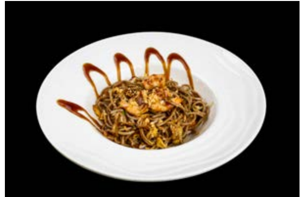
231. Yaki soba € 9 ARACHIDI, SESAMO, TERIYAKI (2-3-6-8-11)*