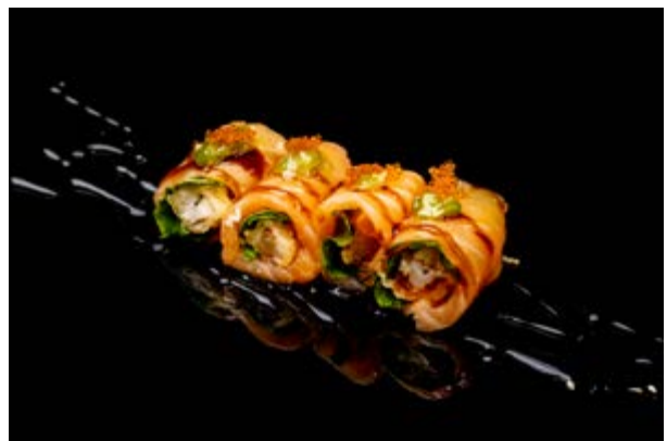
617. Nigiri Zen Special € 10 4pz GAMBERO IN TEMPURA AVVOLTO DA SALMONE E WASABI FRESCO, TOBIKO E SALSA TERIYAKI (1-2-3-4)*