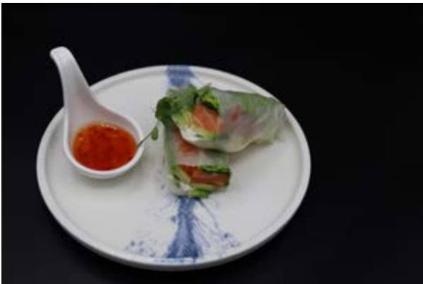
627. Salmon spring € 12 2pz FOGLIO DI RISO, SALMONE, INSALATA, AVOCADO, PHILADELPHIA (4-7)