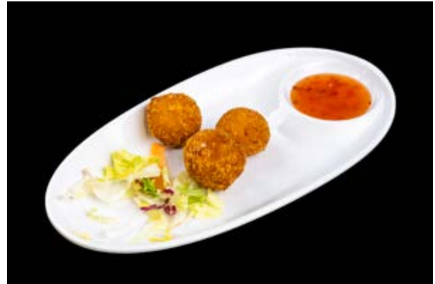
249. Korokke patate € 6 CROCCHETTE CON MAIS E PATATE (1- 15)*