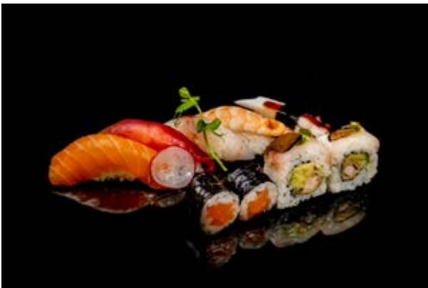
92. Sushi misto € 13 5 nigiri, 2 uramaki, 2 hossomaki (2-4)