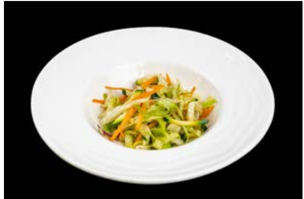
299. Verdure miste saltate € 5 (15)