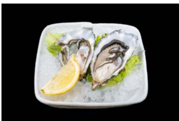
610. Ostriche € 14 (7)