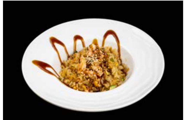
213. Riso con gamberi e verdure € 8 RISO, GAMBERI, VERDURE, SESAMO, ARACHIDI, SALSA MISO, TERIYAKI (2-3- 6-8-11)*