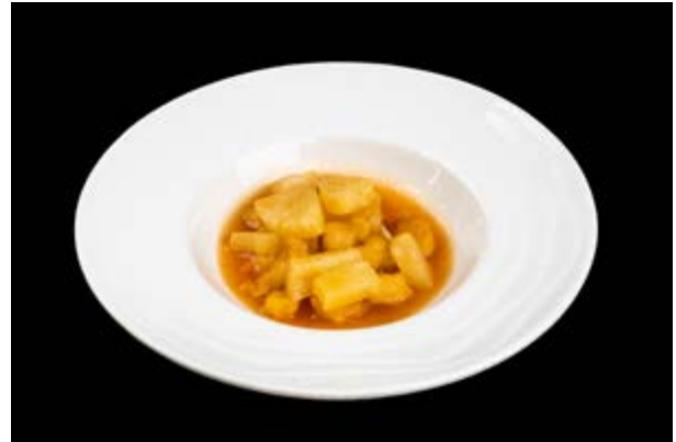
287. Pollo in agrodolce € 7 (1)*