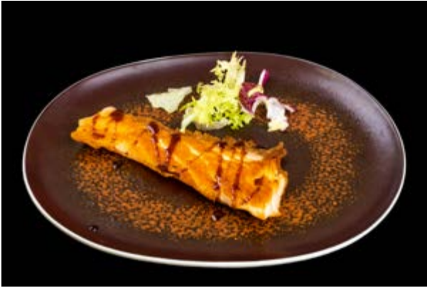
260. Salmone alla piastra € 9 SALMONE E TERIYAKI (4-6)