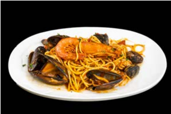
224. Spaghetti allo scoglio € 12 (2-14)*