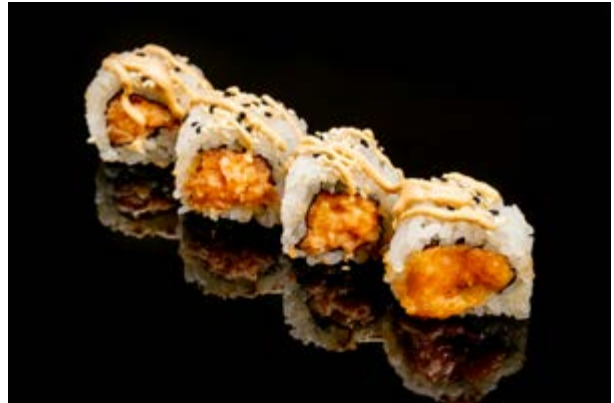
137. Spicy salmon roll € 10 4pz TARTARA DI SALMONE SPICY, SESAMO, SALSA SPICY MAYO (3-4-11)