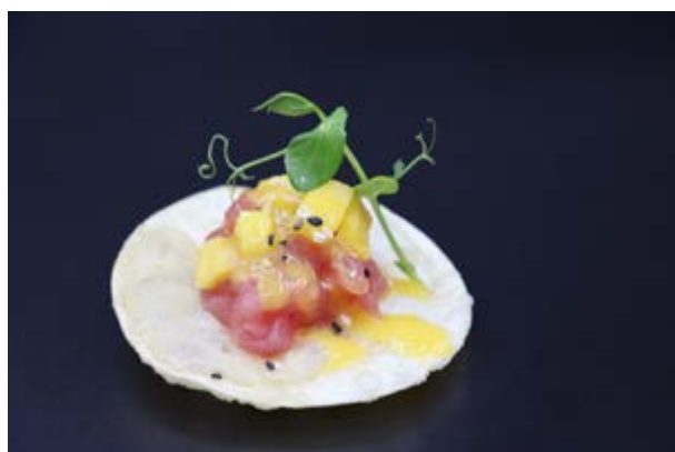
24. Zen fried tuna € 7 1pz FOGLIE DI INVOLTINO, AVOCADO, TARTARE DI TONNO, SALSA MANGO (1-3-4-7)