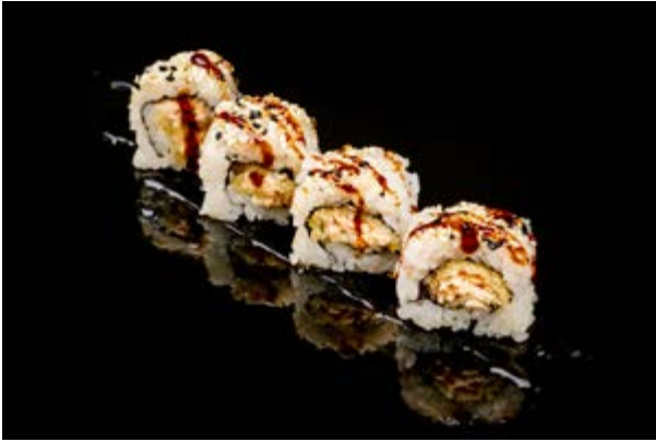
134. Miura roll € 9 4pz SALMONE FRITTO , PHILADELPHIA E TERIYAKI, SESAMO (1-4-6-7-11)