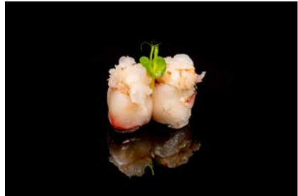
114. Gunkan Rosè € 5 (2-4)