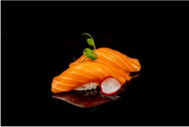
100. Nigiri Salmone € 3 (4)