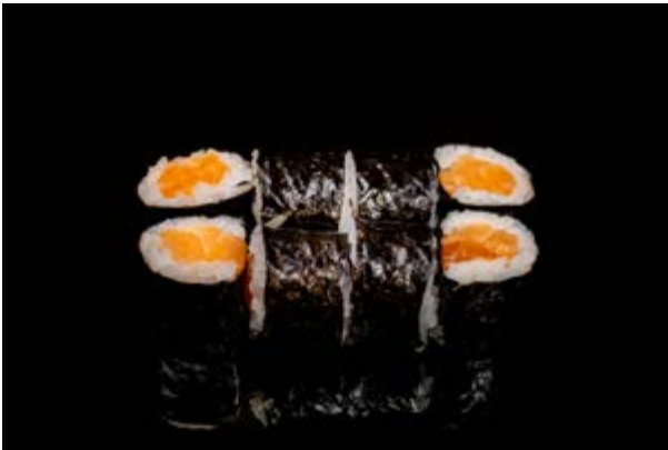
180. Sake maki € 4 8pz SALMONE (4)