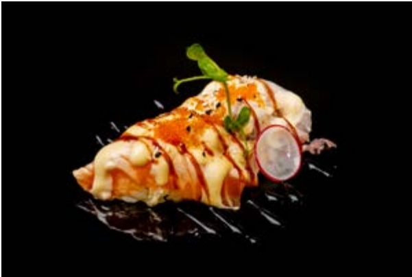
111. Nigiri special burn € 10 SALMONE, TONNO, BRANZINO SCOTTATI, TOBIKO, SESAMO, SALSA MISO E TERIYAKI (4-6-11)