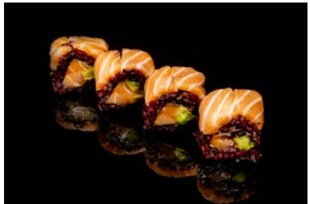
169. Salmon venus € 10 4pz SALMONE AVOCADO, PHILADELPHIA (4-7)