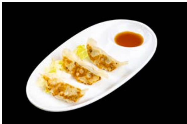
62. Gyoza di pollo € 5 RAVIOLI DI POLLO ALLA PIASTRA (1-6)*