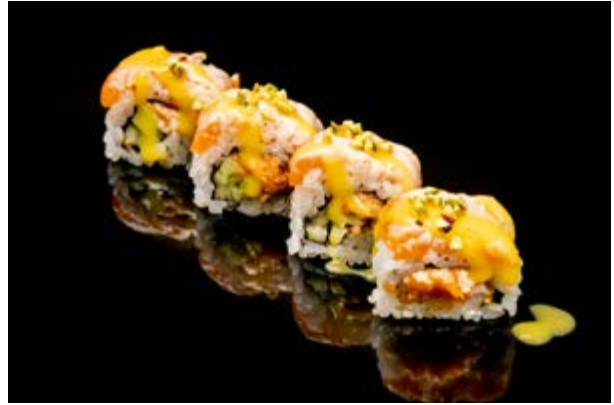
159. Uramaki flambe € 12 4pz TARTA DI SALMONE, CETRIOLI, SALMONE SCOTTATO, PISTACCHIO, SALSA MANGO (4-8)