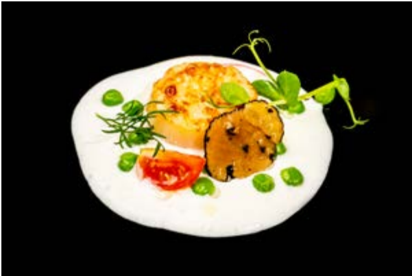
614. Capasanta grigliata € 10 PANNA FRESCA, CAPESANTE, TARTUFO, PISELLI E POMODORINI (7-14)*