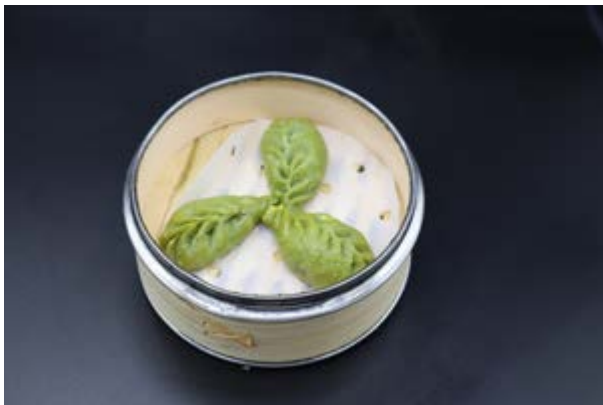
58. Vegetal Gyoza € 6 RAVIOLI DI VERDURE (1-15)*