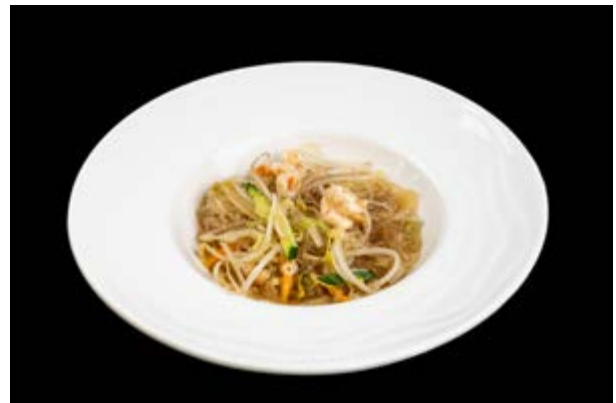
233. Spaghetti di soia con gamberi € 8 (2-6)*