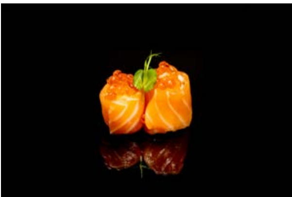
117. Gunkan ikura € 5 SALMONE E IKURA (4)