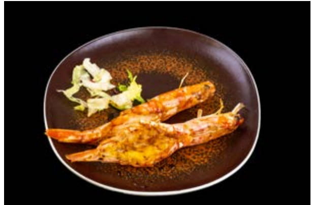
263. Gamberoni alla piastra € 10 GAMBERI E TERIYAKI (2-6)*