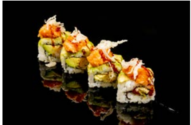
161. Dragon special € 14 4pz GAMBERO IN TEMPURA , PHILADELPHIA ,AVOCADO , SPICY SALMONE , BRICIOLE TEMPURA E SALSA GUACAMOLE (1-2-3-4-6)*