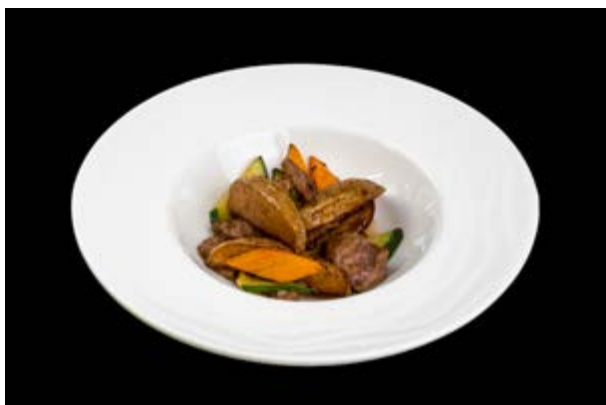
292. Manzo saltato con verdure € 9*