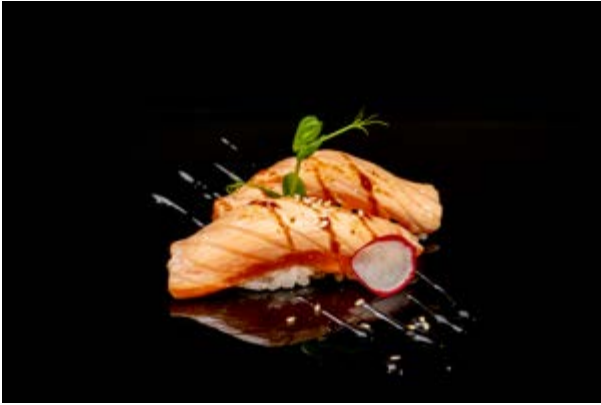
106. Nigiri sake burn € 3 SALMONE, SALSA TERIYAKI, SESAMO (4-6-11)