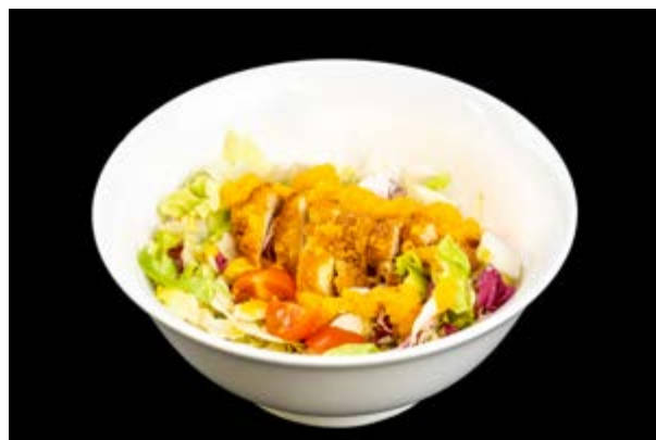
10. Chicken salad € 8 INSALATA CON COTOLETTA DI POLLO (1-10)*