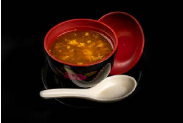
30. Zuppa agropiccante € 3 ZUPPA CON TOFU , FUNGHI , UOVA (3)