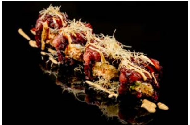
167. Miura plus venus € 14 4pz SALMONE FRITTO , PHILADELPHIA , TARTARA DI TONNO , MAIONESE SPICY , KADAIFI E TERIYAKI (1-3-4-6-7)