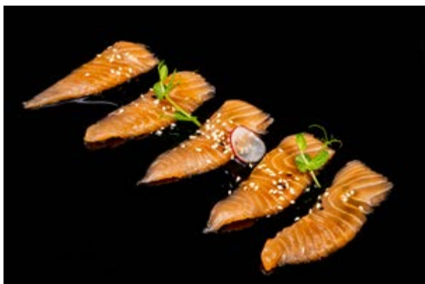
70. Carpaccio di salmone € 10 SALMONE SOTTILE CON SALSA E SESAMO (4-6-11)