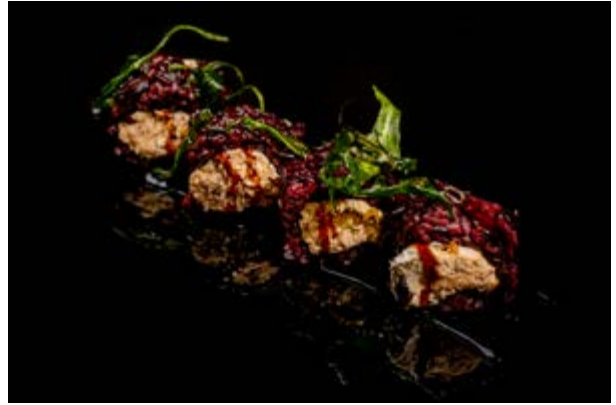
165. Miura black € 10 4pz SALMONE COTTO E PHILADELPHIA , RUCOLA FRITTA E TERIYAKI (1-4-6-7)