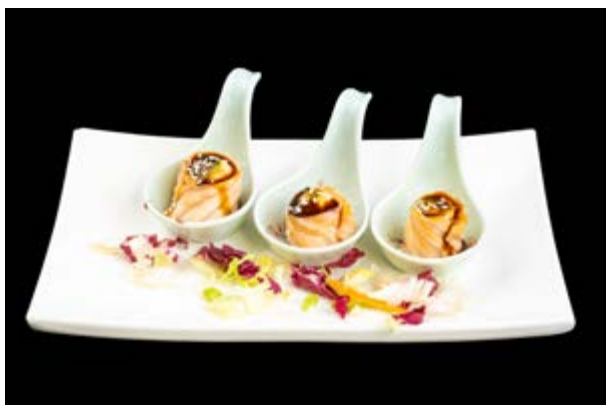
1. Antipasto Zen € 8 PURE DI PATATE , SALMONE , ASPARAGI, SALSA TERIYAKI (1-4-7)