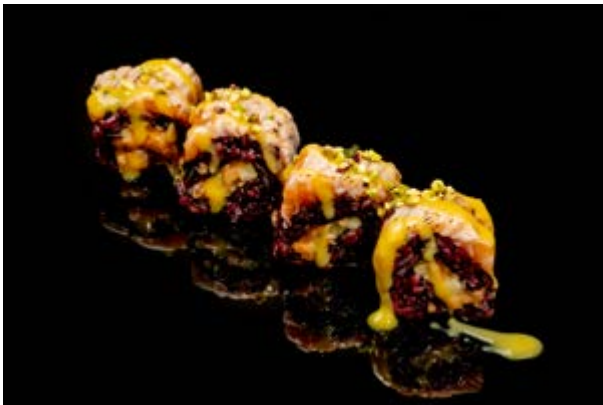
166. Black Pistacchio € 12 4pz TARTARA DI SALMONE ,CETRIOLI , SALMONE SCOTTATO , PISTACCHIO , SALSA MANGO (4-8)