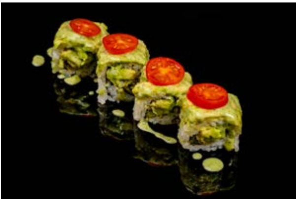
162. Vegetarian roll € 10 4pz ASPARAGO FRITTO ,CETRIOLI , AVOCADO , POMODORINI , SALSA RUCOLA (1-15)