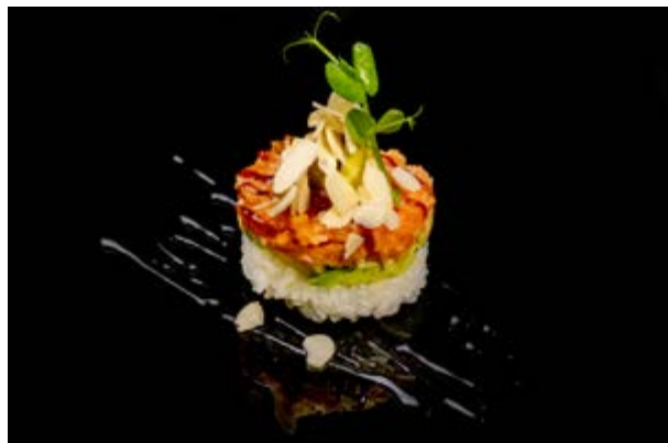
79. Chirashi al salmone € 10 TORTINO DI RISO CON TARTARA DI SALMONE , AVOCADO, TERIYAKI, MANDORLE (4-6-8)