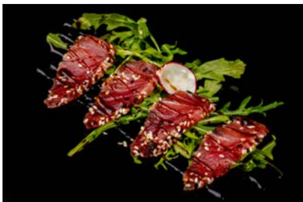
76. Tuna tataki € 12 TONNO SCOTTATO IN CROSTA DI SESAMO (4-6-11)