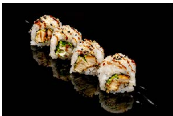
133. Chicken roll € 8 4pz POLLO FRITTO , MAIONESE , INSALATA, SESAMO, TERIYAKI (1-3-6-11)*