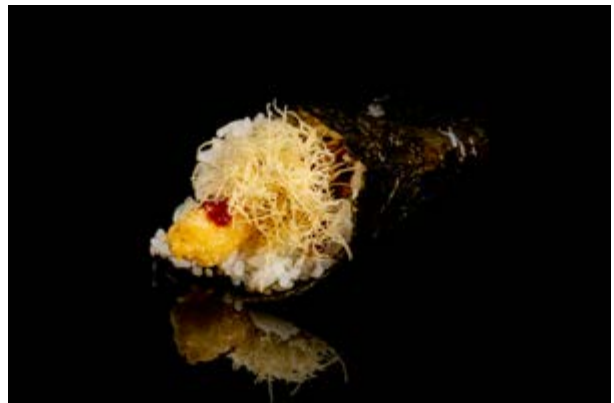
197. Temaki ebiten € 5 GAMBERO IN TEMPURA , MAIONESE , KADAIFY , TERIYAKI (1-2-3-6)*