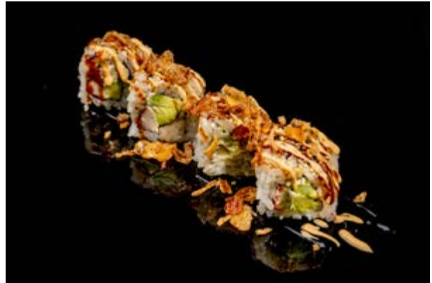
143. Onion roll € 12 4pz SURIMI DI GRANCHIO , CETRIOLO , MAIONESE PICCANTE , CIPOLLA FRITTA (2-3-6)*