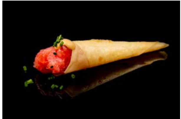
195. Cono tonno € 5 TONNO , MAIONESE SPICY (1-3-4)