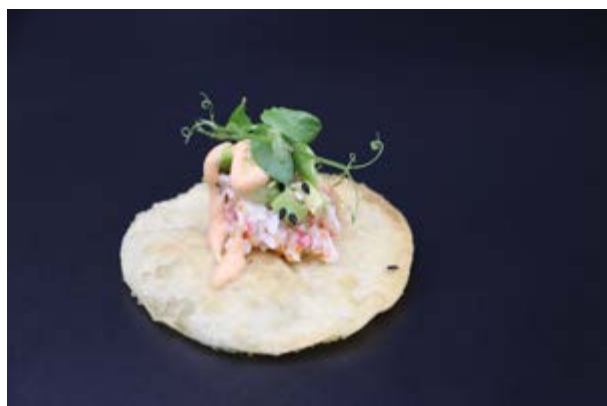
22. Zen Fried surimi € 7 1pz FOGLIE DI INVOLTINO, AVOCADO, TARTARE DI SURIMI, GAMBERO COTTO, SALSA SPICY MAYO (1-2-3-4-7)*