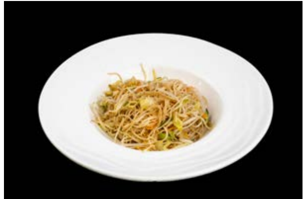
225. Spaghetti di riso con verdure € 6 (3-6-15)