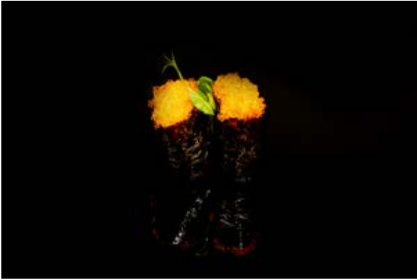
119. Gunkan tobiko € 5 (4)