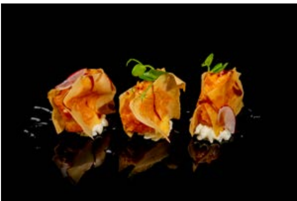
616. Millefoglie di salmone € 10 2pz SALMONE, PHILADELPHIA, PASTA SFOGLIA (1-4-7)