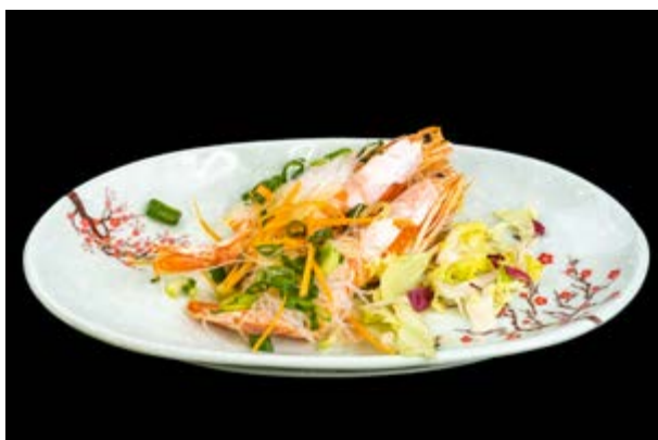
294. Gamberoni al vapore € 12 ( massimo 1 volta a persona ) GAMBERI AL VAPORE CON SALSA DI SOIA E ACETO, ERBA CIPOLLINA (1-2-6)*