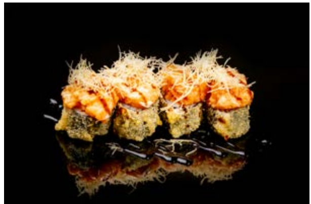
191. Zen roll fry € 12 4pz SALMONE AVOCADO PHILADELPHIA ,SALMONE SPICY ,TERIYAKI KADAIFI (1-4-6-7)