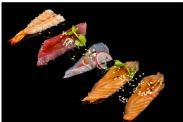
72. Carpaccio misto € 10 SALMONE , TONNO , BRANZINO , GAMBERI , CON SALSA E SESAMO (2-4- 6-11)