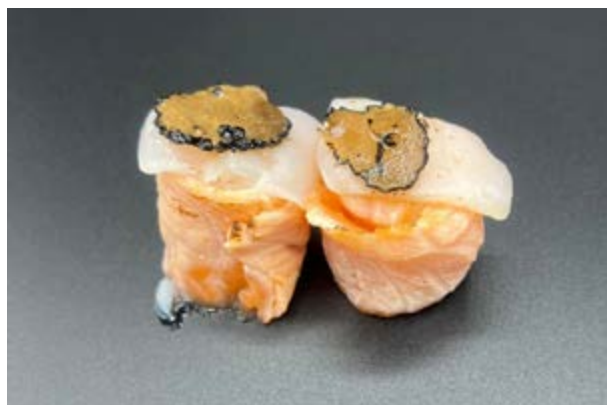
125. Gunkan delicious flambè € 6 SALMONE , CAPASANTA , TARTUFO , SALSA PASSION FRUIT (4-14)