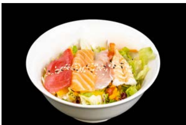
11. Sashimi salad € 9 INSALATA CON PESCE MISTO (2-4-10)