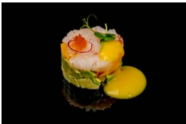
606. Tartare di gambero € 10 GAMBERO , AVOCADO , SALSA MANGO, TOBIKO (2)*