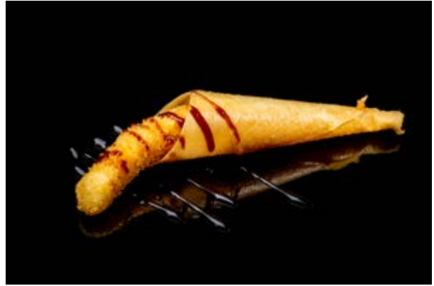
193. Cono ebi € 5 GAMBERO IN TEMPURA E TERIYAKI (1- 2-3-6)*