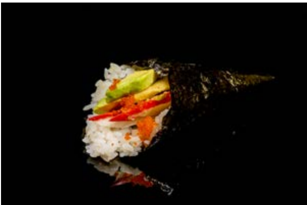
196. Temaki california € 5 SURIMI DI GRANCHIO,AVOCADO ,MAIONESE , TOBIKO (2-3)*