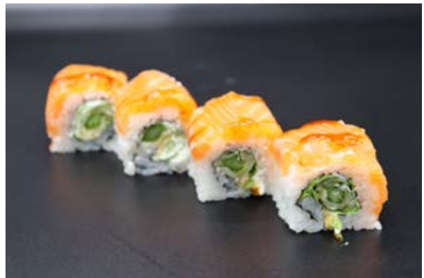
163. Caterpillar plus € 10 4pz SALMONE AFFUMICATO, ASPARAGI IN TEMPURA, RUCOLA, PHILADELPHIA (1-3-7-15)