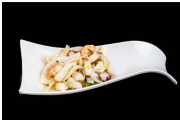
4. Frutti di mare misti € 6 GAMBERI , POLIPO, CALAMARO (2-14)*