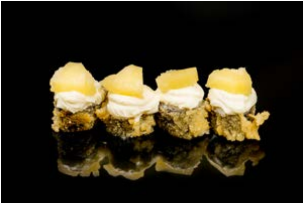
188. Sake maki ananas € 10 4pz SALMONE PHILADELPHIA ANANAS (4- 7)