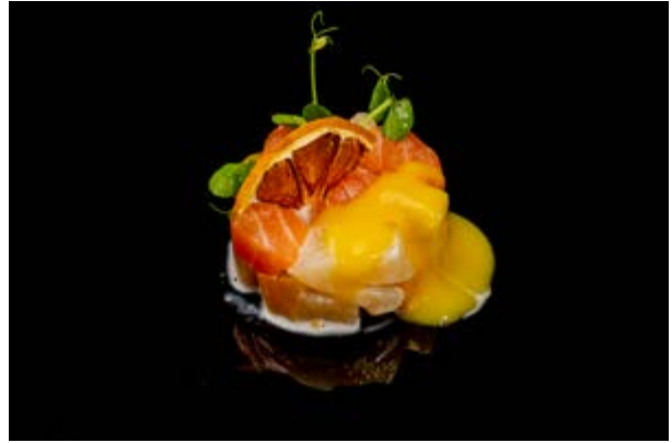
83. Tartare exotic € 9 TARTARA DI SALMONE CON FRUTTA ESOTICA E MAYONESE AL MANGO (4)