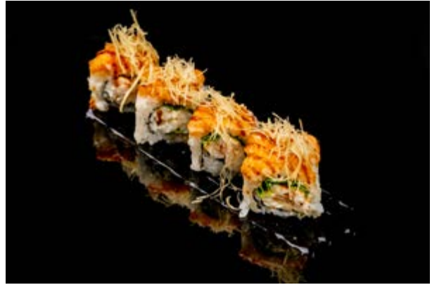
147. Special ebi € 12 4pz GAMBERO COTTO, INSALATA, MAIONESE, TARTARA DI SALMONE, KADAIFI, TERIYAKI (1-2-3-4)*