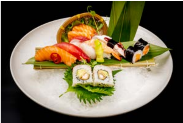
94. Susa misto € 15 7 sashimi, 5 nigiri, 2 uramaki, 2 hossomaki (2-4)