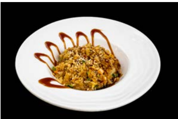
214. Riso con salmone e verdure € 8 RISO, SALMONE, VERDURE, SESAMO, ARACHIDI, SALSA MISO, TERIYAKI (3-4- 6-8-11)