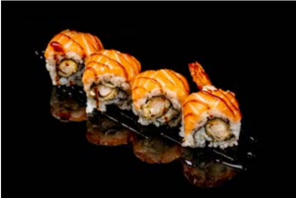
140. Tiger roll € 12 4pz GAMBERO IN TEMPURA , MAIONESE ,SALMONE , TERIYAKI (1-2-3-4-6)*