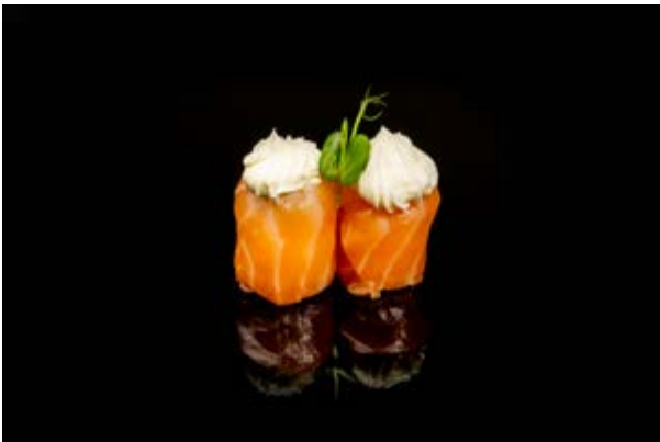
115. Salmone out philadelphia € 5 (4-7)