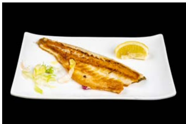
267. Branzino alla piastra € 10 (4)*