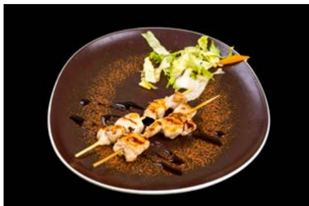
271. Spiedini di pollo € 7 POLLO E TERIYAKI (6)*