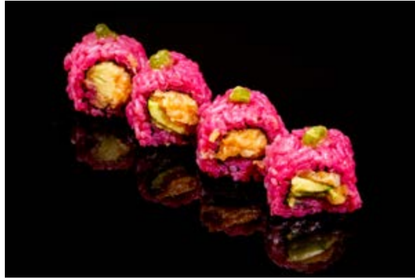
172. Lady rosato € 12 4pz TARTARA DI SALMONE AVOCADO, WASABI FRESCO (4)