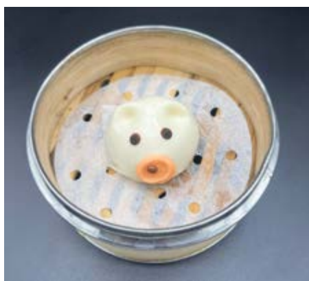
54. Bao con fagioli € 6 Pane dolce con fagioli rossi (1-7-15)