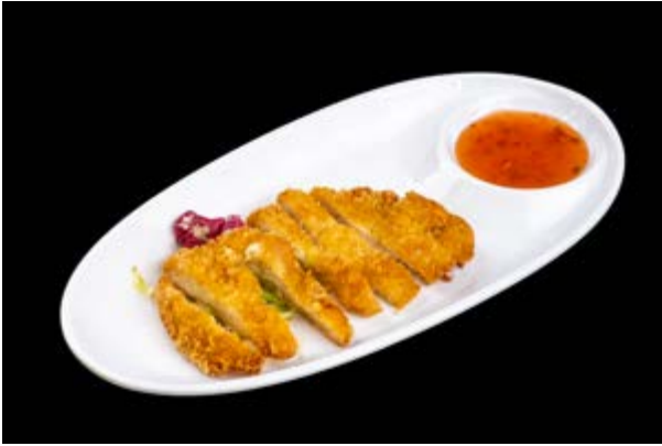
246. Chicken Katsu € 6 COTOLETTA DI POLLO (1-3)*