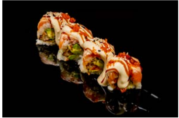
601. Anguilla Roll € 15 4pz ANGUILLA ARROSTO AVOCADO SALMONE SALSA DI MISO TERIYAKI (4-6-11)*