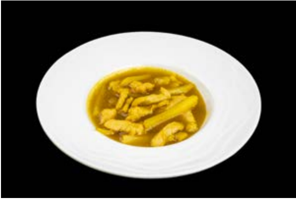
284. Pollo al curry € 7 POLLO, PATATE, CIPOLLE AL CURRY (1)*