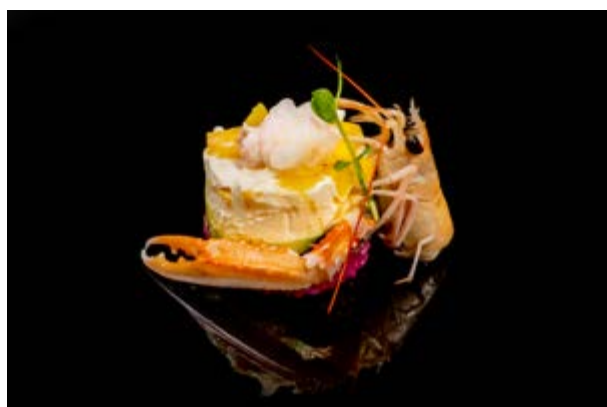
81. Chirashi rosato € 13 TORTINO DI RISO ALLA BARBABIETOLA CON SCAMPI , MANGO E PHILADELPHIA, AVOCADO (2-7)