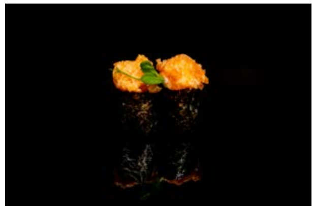
118. Gunkan spicy salmone € 5 (4)