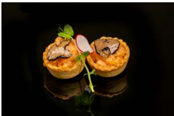
19. Biscotti al tartufo € 10 BISCOTTO CON TARTARA DI SALMONE E TARTUFO (1-4-7)