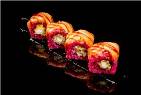
173. Tiger rosato € 12 4pz GAMBERO IN TEMPURA , MAIONESE , SALMONE ,TERIYAKI (1-2-3-4-6)*