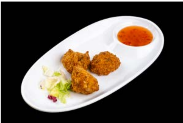
250. Korokke sake € 6 CROCCHETTE CON SALMONE E RISO (1-4)*