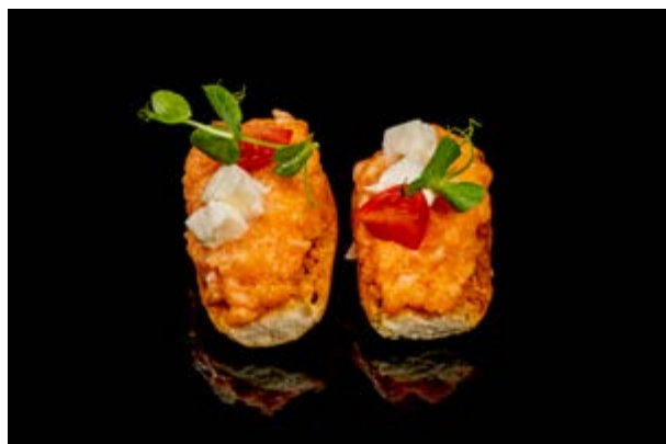
20. Crostini con tartara € 10 CROSTINI CON SALMONE E MOZZARELLA (1-4-7)