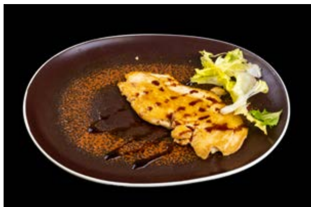
269. Pollo alla piastra € 8 POLLO E TERIYAKI (6)*