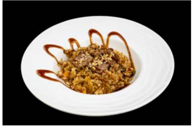
217. Riso con manzo e verdure € 8 RISO, MANZO, VERDURE, SESAMO, ARACHIDI, SALSA MISO, TERIYAKI (3-6- 8)