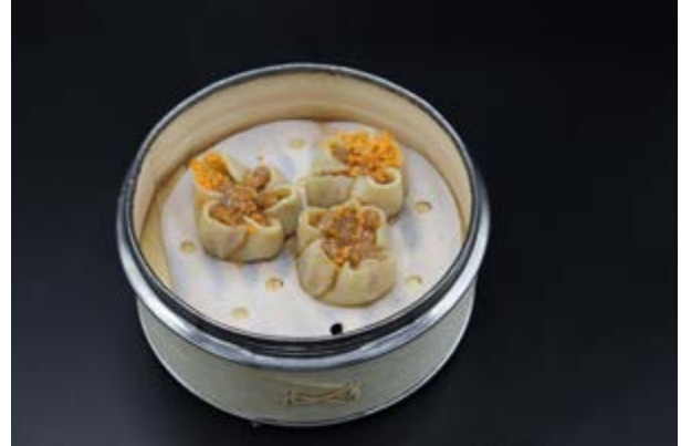
57. Shaomai € 5 RAVIOLI DI GAMBERI E PANCETTA (1-2-3-4-6)*