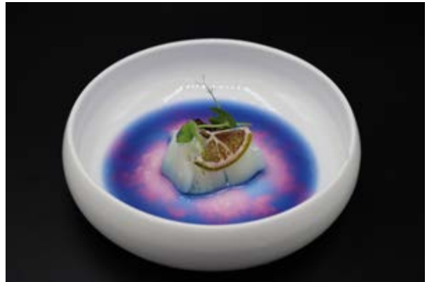
613. Capasanta con tartufo € 8 (7-14)* - Non adatto a donne in gravidanza per presenza di spezia simile allo zafferano.