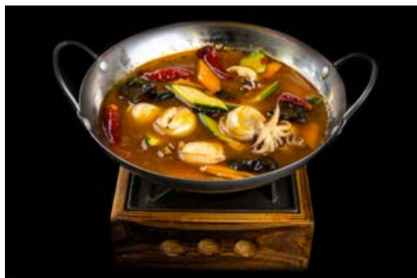
283. Scodella di seppie € 10 SEPPIE , FUNGHI , CAROTE , ZUCCHINE , PEPERONCINO (6-14-16)*