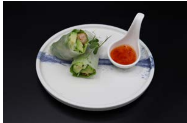
626. Ebi spring roll € 12 2pz FOGLIO DI RISO, GAMBERO FRITTO, INSALATA, AVOCADO, CETRIOLO (1-2)*