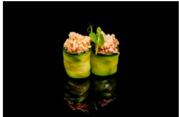
116. Gunkan zucchini € 5 MAIONESE, ZUCCHINE, GAMBERI, SURIMI, TOBIKO (2-3)