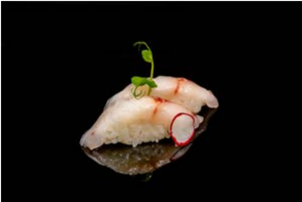
102. Nigiri Branzino € 3 (4)