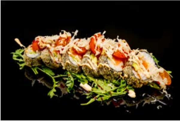
186. Futomaki fritto € 12 4pz SALMONE AVOCADO POMODORINI RUCOLA ,BRICIOLE DI TEMPURA, TERIYAKI , MAIONESE SPICY (3-4-6)