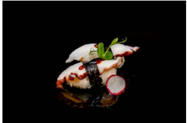
109. Nigiri tako € 4 POLIPO, SALSA TERIYAKI (4-11)*