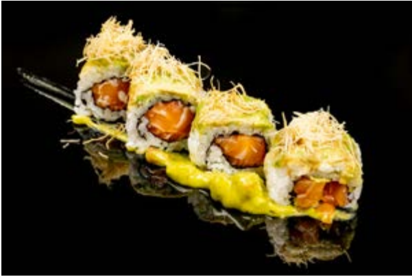
146. Avocado roll special € 12 4pz SALMONE , PHILADELPHIA , AVOCADO , KADAIFI , SALSA GUACAMOLE (4-6-7-8)