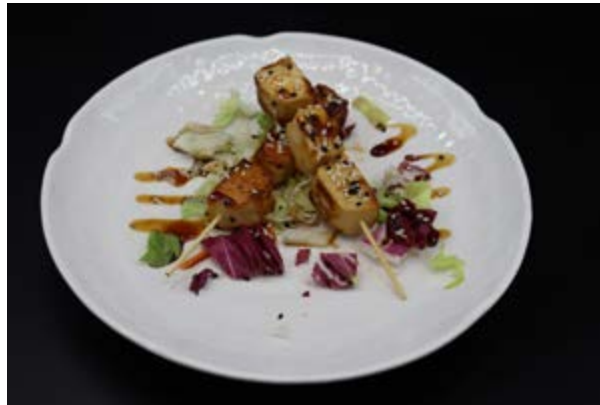
272. Spiedini di tofu € 7 TOFU, TERIYAKI E SESAMO (6-11)