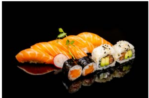
93. Sushi di salmone € 12 9pz 5 nigiri, 2 uramaki, 2 hossomaki (4)