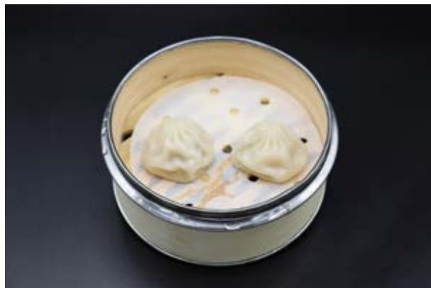
53. Xiao long bao € 3 2pz Bao al vapore ripieno con carne di maiale (1-7)*