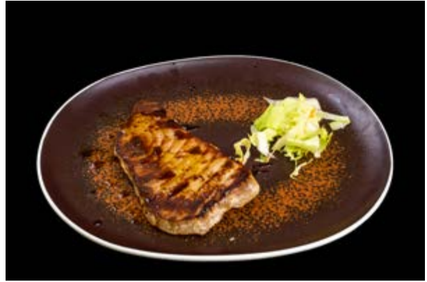
261. Tonno alla piastra € 10 TONNO E TERIYAKI (4-6)*