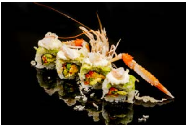
604. Scampi Roll € 15 4pz SCAMPO CRUDO , ASPARAGI E VERDURE IN TEMPURA , AVOCADO , PHILADELPHIA (1-2-7)*