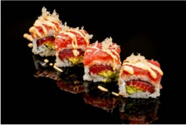
158. Tuna plus € 12 4pz TONNO AVOCADO , TARTARA DI TONNO SPICY , BRICIOLE TEMPURA E MAIONESE SPICY, TERIYAKI (1-3-4)