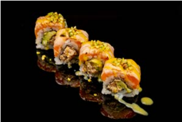
154. Pistacchio sake € 12 4pz SALMONE COTTO , AVOCADO , PHILADELPHIA , PISTACCHIO E SALSA MANGO (4-7-8)