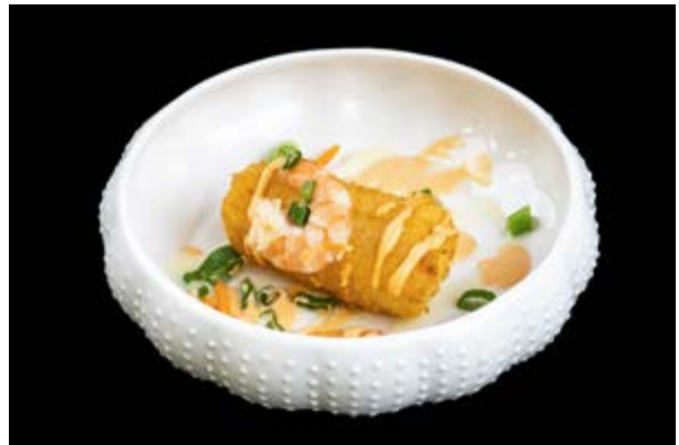
622. Tofu fritto € 5 TOFU FRITTO CON GAMBERI , CIPOLLINA E SPICY MAYO (1-2-3)