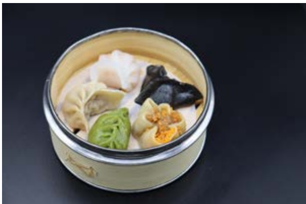
60. Gyoza mix € 6 RAVIOLI MISTI (1-2-3-4-6)*