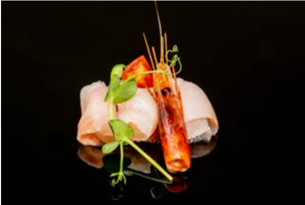
618. Ricciola e gamberi rossi € 12 RICCIOLA, GAMBERI ROSSI E SALSA AL FRUTTO DELLA PASSIONE (2-4)*