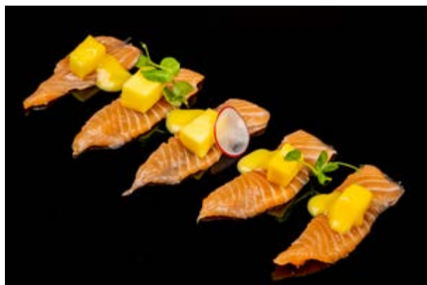
71. Carpaccio di salmone e mango € 10 SALMONE CON SALSA MANGO (4)