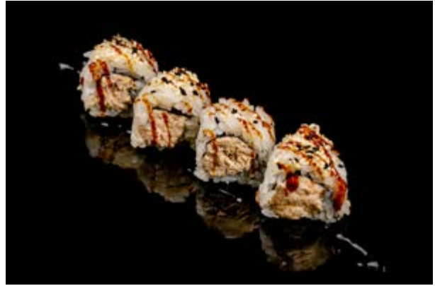
135. Tuna philadelphia € 9 4pz TONNO COTTO , PHILADELPHIA E TERIYAKI, SESAMO (4-6-7-11)