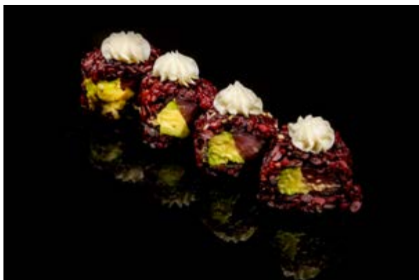
170. Tuna venus € 11 4pz TONNO AVOCADO PHILADELPHIA (4-7)