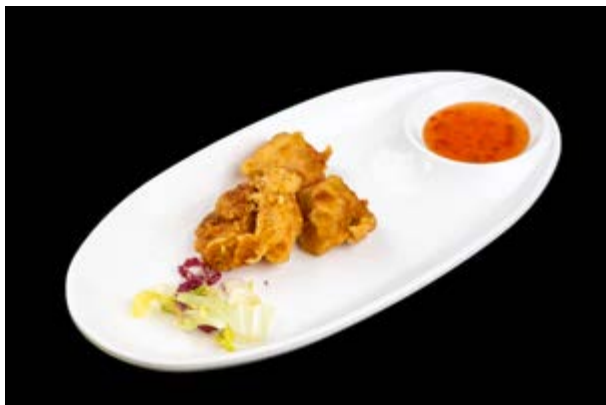
254. Tori no kaarage € 6 PEPITE DI POLLO FRITTE (1)*