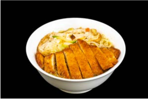
222. Ramen in zuppa con cotoletta di pollo € 12 ALGHE, UOVA, POLLO FRITTO (1-3)*