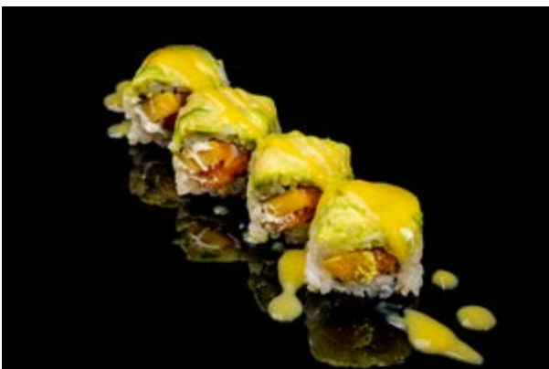
144. Mango roll € 12 4pz MANGO , AVOCADO , SALMONE ,PHILADELPHIA, SALSA MANGO (4-7)