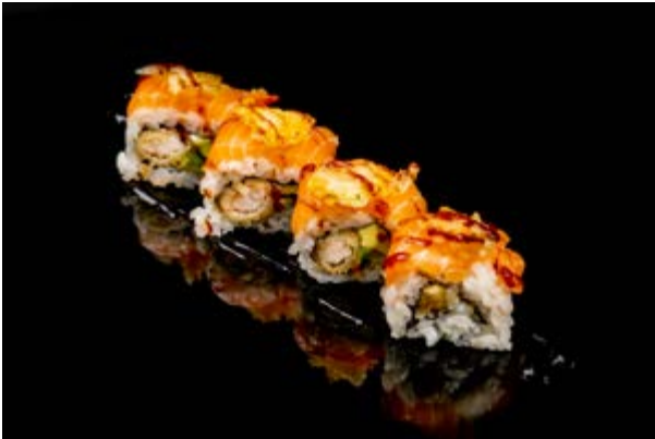
142. Ebi flower € 14 4pz GAMBERO FRITTO , AVOCADO , SALMONE ,FIORI DI ZUCCA FRITTI E TERIYAKI (1-2-4-6)*