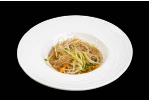
232. Spaghetti di soia con verdure € 7 (6-15)