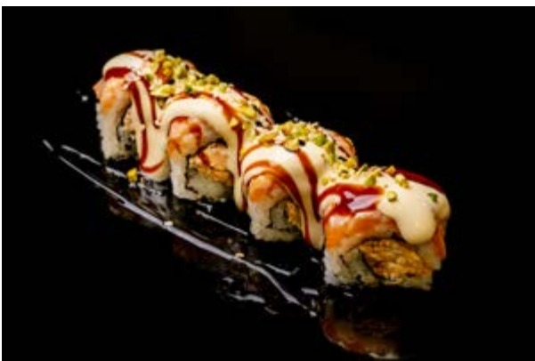
156. Zen roll special € 14 4pz SALMONE COTTO , PHILADELPHIA , SALSA DI MISO ,TERIYAKI E PISTACCHIO, SESAMO (4-6-7-8-11)