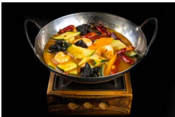
280. Scodella di gamberi € 10 GAMBERI , FUNGHI , CAROTE , ZUCCHINE ,PEPERONCINO (2-6-16)*