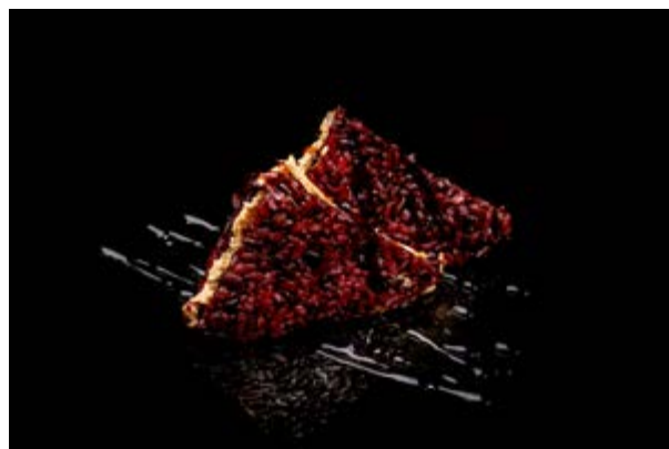
17. Onigiri Black sandwich € 6 SALMONE COTTO E PHILADELPHIA (1- 6-7)