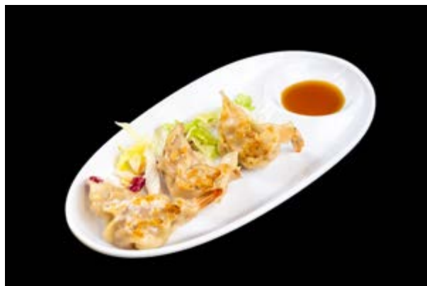
63. Niku Gyoza € 6 RAVIOLI DI CARNE ALLA PIASTRA (1-6)*