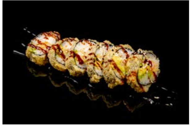
187. Fritto maki € 12 4pz GAMBERO IN TEMPURA ,AVOCADO , MAIONESE , SALSA TERIYAKI (1-2-3-6)*