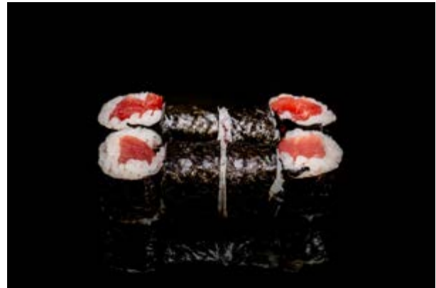
181. Tekka maki € 4 8pz TONNO (4)