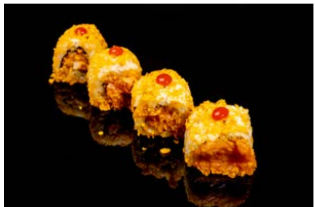
145. Mexican roll € 10 4pz TARTARA DI SALMONE SPICY, NACHOS, SALSA SRIRACHA (4)