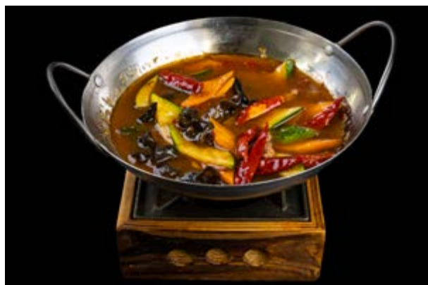
281. Scodella di manzo € 10 MANZO , FUNGHI , CAROTE , ZUCCHINE ,PEPERONCINO (6-16)*