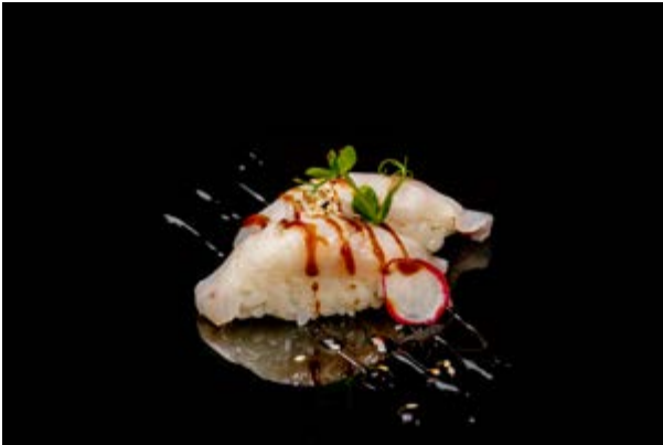
108. Nigiri suzuki burn € 3 BRANZINO, SALSA TERIYAKI, SESAMO (4-6-11)