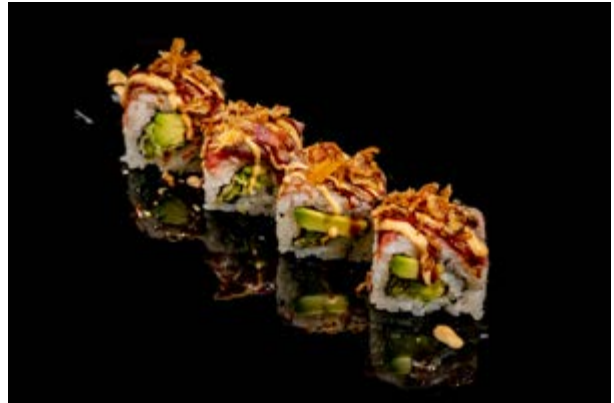
149. Manzo roll € 13 4pz ASPARAGO FRITTO , AVOCADO , MANZO SCOTTATO , CIPOLLA FRITTA, SALSA SPICY MAIO E TERIYAKI (1-3)*