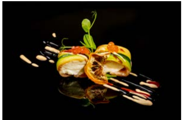
603. Caprino Roll € 10 ZUCCHINE , PHILADELPHIA , IKURA, PESTO, SPICY MAYO (3-7)