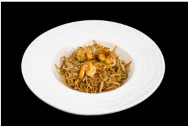
226. Spaghetti di riso con gamberi € 8 (2-3-6)*