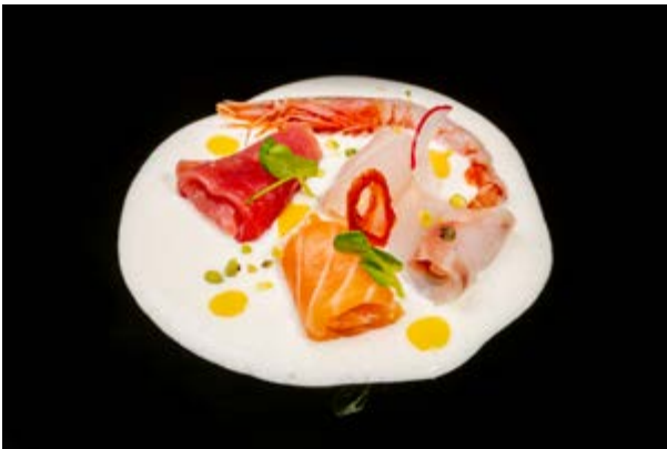
602. Pesce misto con panna € 15 SALMONE, TONNO, BRANZINO GAMBERO ROSSO, RICCIOLA (2-4-7-14)