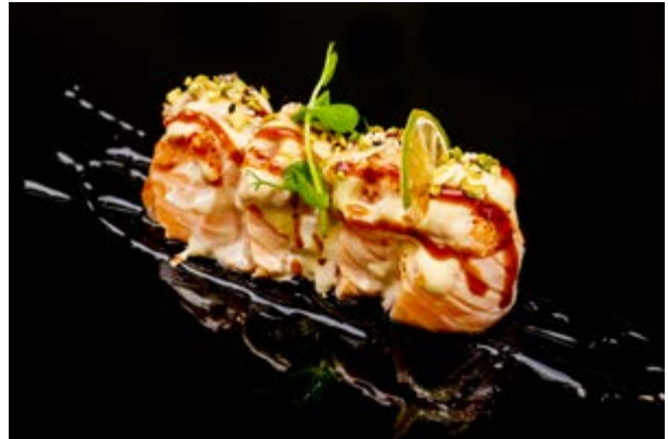
112. Gunkan con salsa di miso € 10 SALMONE SCOTTATO, PISTACCHIO, SALSA MISO E TERIYAKI (4-8)