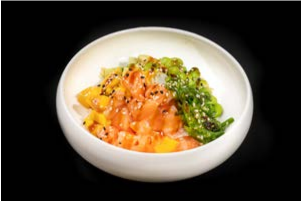
40. Pokè Salmone € 12 RISO , SALMONE , AVOCADO , EDAMAME , POMODORINI , MANGO (4)