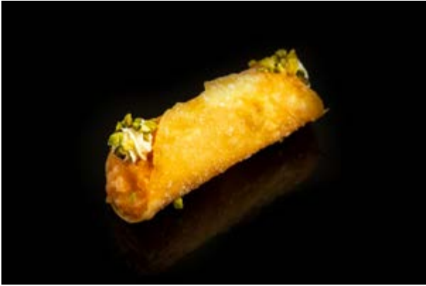
192. Cannolo di salmone € 8 SALMONE ,PHILADELPHIA , PISTACCHIO (1-4-7-8)