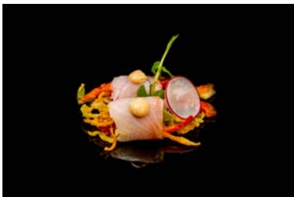
124. Crunchy ricciola € 6 RICCIOLA, VERDURA MISTA IN TEMPURA, SALSA SPICY MAYO (1-3-4)