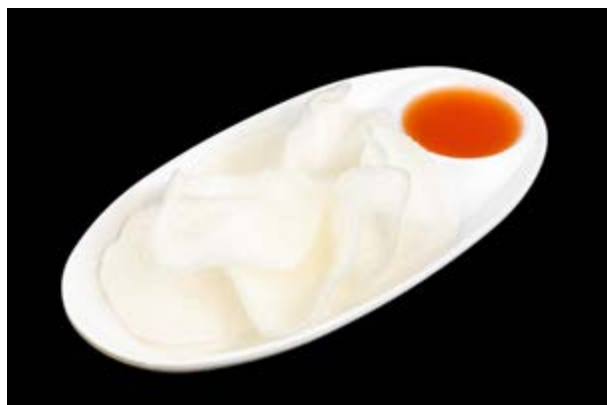
2. Nuvole € 3