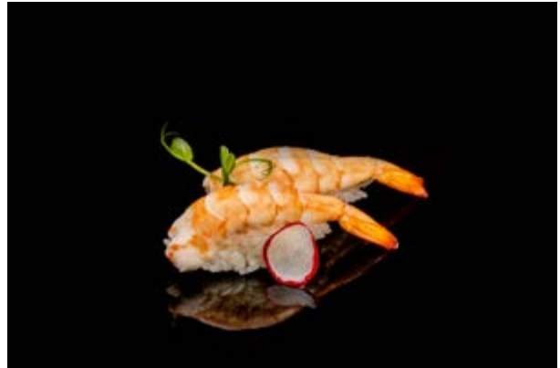
103. Nigiri Ebi € 3 (2)*