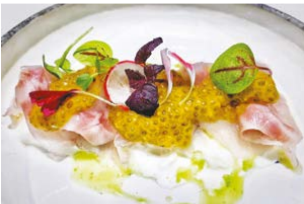
623. Ricciola con mozzarella di bufala € 15,00 RICCIOLA CON MOZZARELLA DI BUFALA E PASSION FRUIT (2-4)