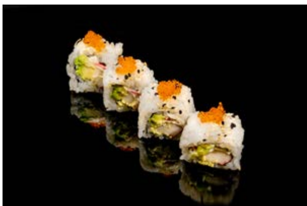
132. California roll € 8 4pz SURIMI DI GRANCHIO, AVOCADO, TOBIKO, MAIONESE, SESAMO (2-3-11)*