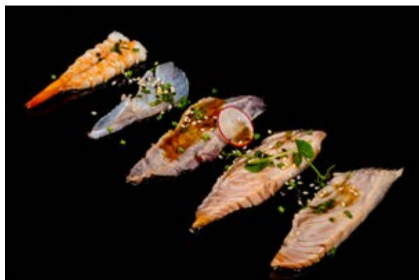
73. Carpaccio misto scottato € 12 SALMONE , TONNO , BRANZINO , GAMBERI SCOTTATI CON SALSA E SESAMO (2-4-6-11)