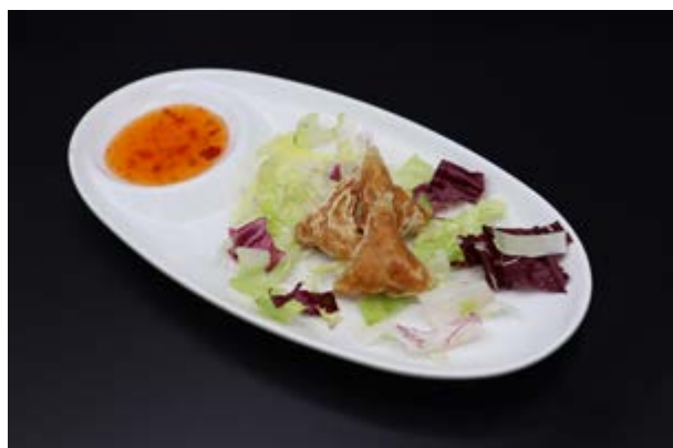
64. Gyoza fritto con pollo € 3 (1-7)*