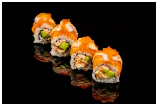
151. Rosso siciliano € 14 4pz GAMBERO COTTO , SURIMI DI GRANCHIO , AVOCADO , GAMBERO ROSSO , SALMONE , TOBIKO, MAIONESE (2-3-4)*