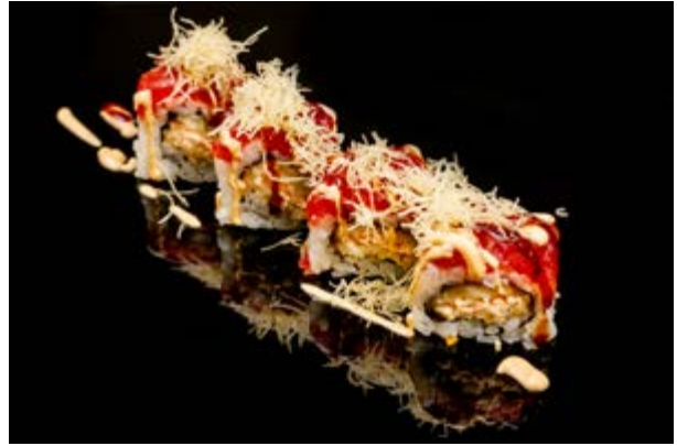
153. Miura plus € 14 4pz SALMONE FRITTO , PHILADELPHIA , TARTARA DI TONNO , MAIONESE SPICY , KADAIFI E TERIYAKI (1-3-4-6-7)