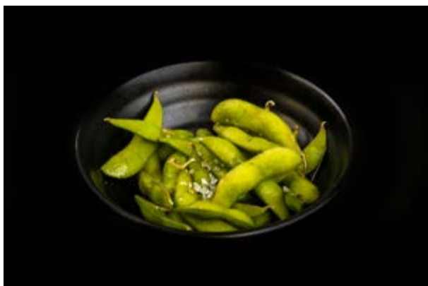
3. Edamame € 3 Baccelli di soia (6)*