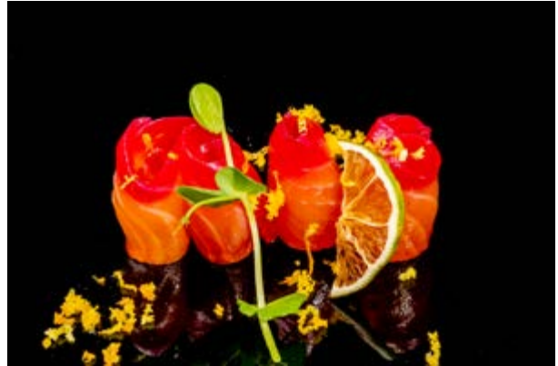
619. Salmone affumicato con barbabietola € 12 (4)