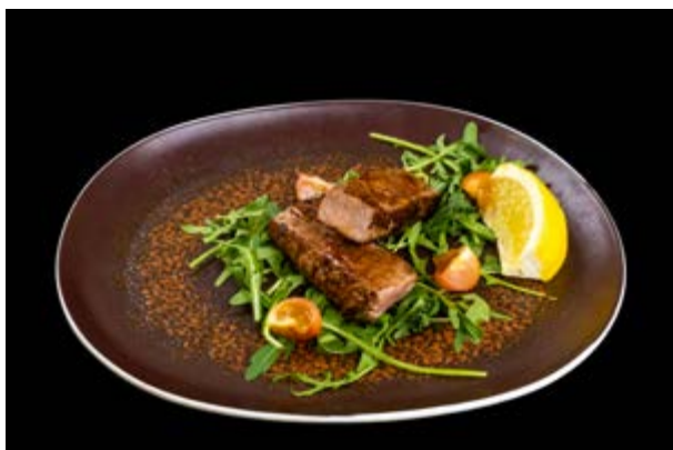
268. Manzo alla piastra € 10*