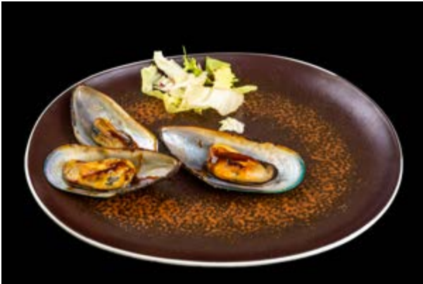
262. Cozze alla piastra € 8 COZZE E TERIYAKI (6-14)*