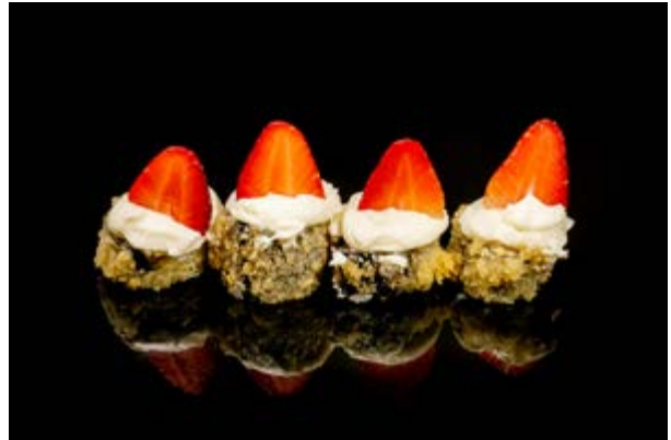
189. Sake maki ichigo € 10 pz SALMONE PHILADELPHIA FRAGOLE (4-7)