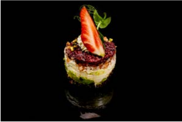
82. Chirashi Venus € 12 TORTINO DI RISO VENERE CON TARTARA DI SALMONE , AVOCADO ,PHILADELPHIA E TERIYAKI, PISTACCHIO (4-6-7-8)