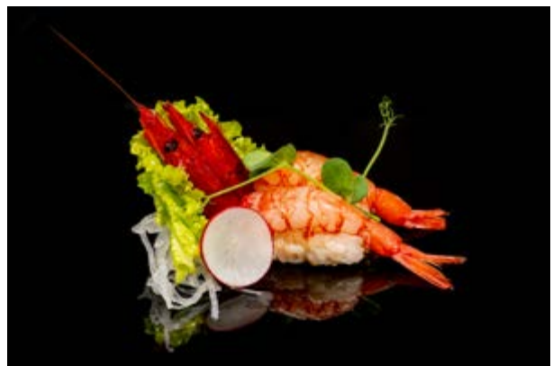
105. Nigiri amaebi € 5 (2)*