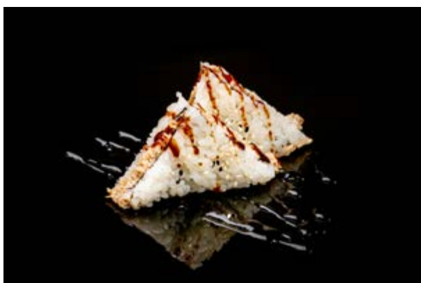
18. Onigiri Zen € 6 SALMONE COTTO E PHILADELPHIA (1- 6-7)