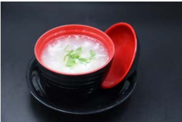
32. Zuppa pollo e mais € 3 ZUPPA CON POLLO, MAIS, UOVA, ERBA CIPOLLINA (3)