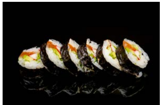
185. Futomaki € 12 4pz SALMONE AVOCADO SURIMI CETRIOLI TOBIKO PHILADELPHIA INSALATA (3-4- 6)*