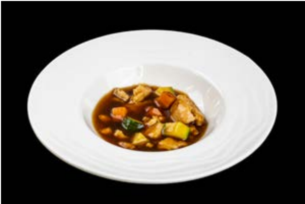
286. Pollo con mandorle € 8 (6-8)*