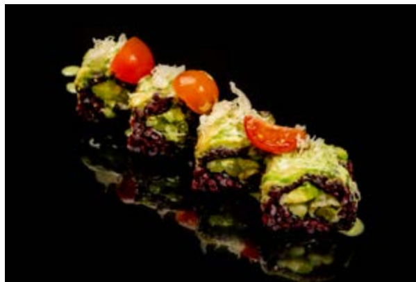
171. Vegetarian venus € 10 4pz ASPARAGO FRITTO , CETRIOLO , POMODORINI , AVOCADO ,SALSA RUCOLA (1-15)