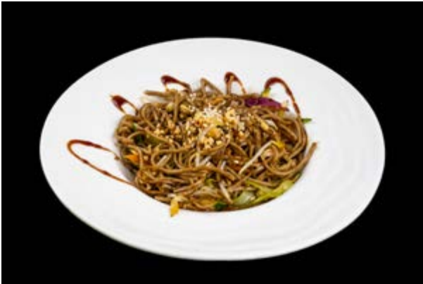
230. Soba con pollo e verdure € 9 ARACHIDI, SESAMO, TERIYAKI (3-6-8-11)*