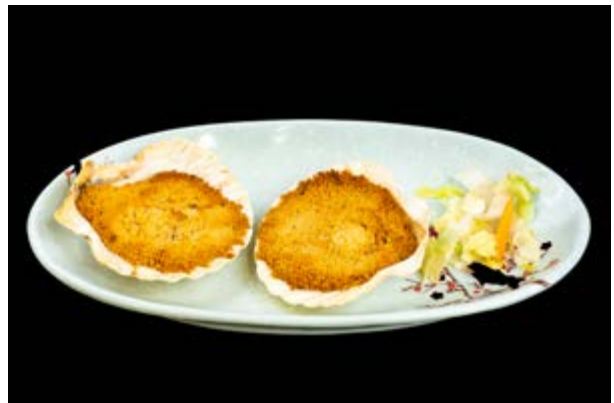
624. Capesante gratinate € 12 (1-14)*