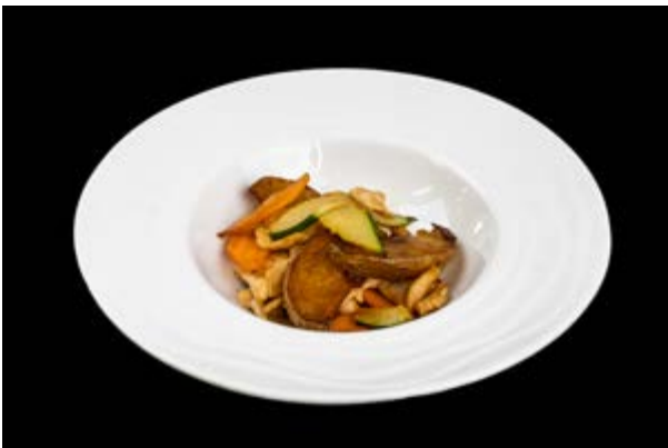
288. Pollo saltato con verdure € 7 (6)