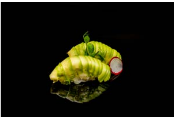
104. Nigiri avocado € 3 (15)