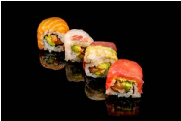
136. Rainbow roll € 12 4pz PESCE MISTO E AVOCADO (2-4)