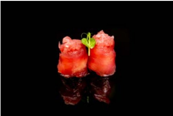
113. Gunkan tuna out € 5 (4)