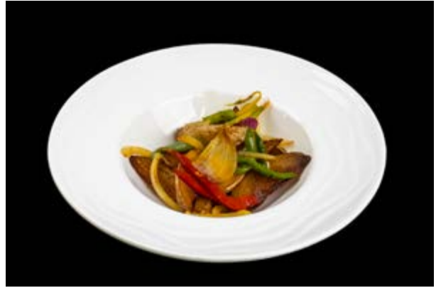
297. Patate e sale e pepe € 5 (15)