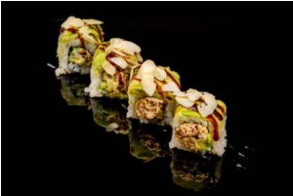
148. Philadelphia special € 12 4pz SALMONE COTTO , PHILADELPHIA, AVOCADO , MANDORLE , TERIYAKI (4- 6-7-8)