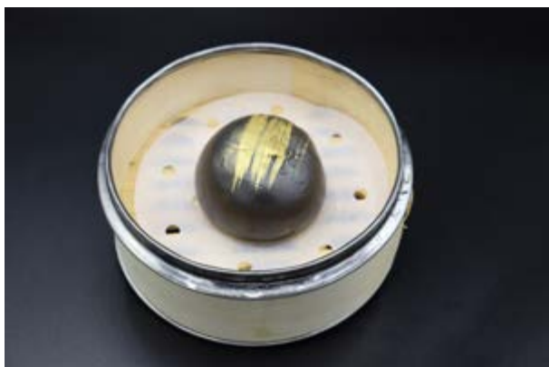
52. Bao black € 3 1pz Pane dolce al vapore con salsa crema (1-7-15)