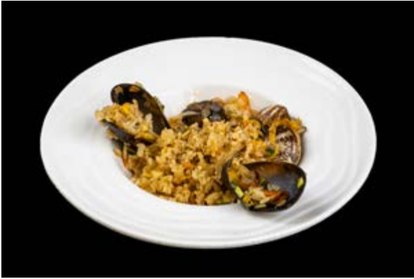
216. Riso con frutti di mare € 9 (2-3-4-6-8)*