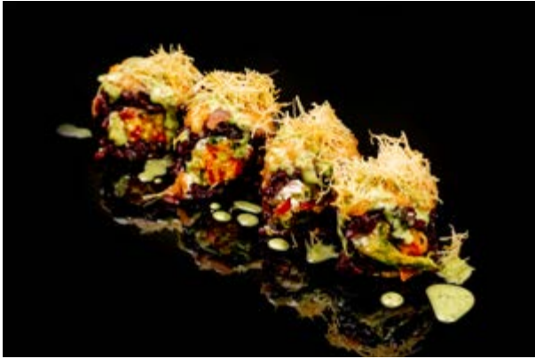
164. Black crazy € 12 4pz TEMPURA DI VERDURE MISTE, PHILADELPHIA, SPICY SALMONE, SALSA RUCOLA, KADAIFI (1-4-7)