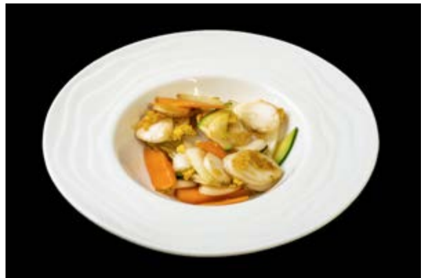
221. Gnocchi di riso con verdure € 9 (15)