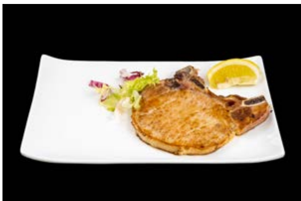
266. Braciola alla piastra € 8*