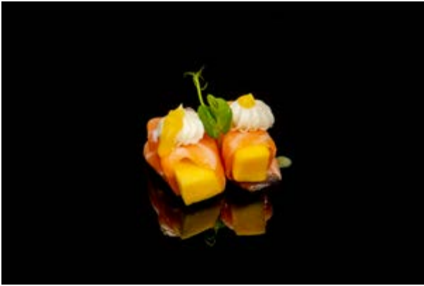
121. Mango sake € 6 SALMONE, MANGO, PHILADELPHIA, SALSA MANGO (4-7)