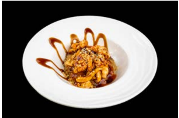
219. Zen don € 10 RISO, POLLO, GAMBERI, VERDURE, SESAMO, ARACHIDI, SALSA MISO, TERIYAKI (2-6-8)*