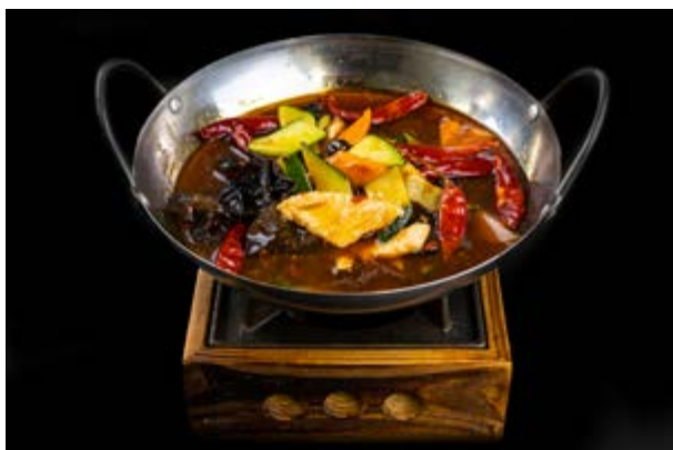
282. Scodella di pollo € 10 POLLO , FUNGHI , CAROTE , ZUCCHINE , PEPERONCINO (6-16)*