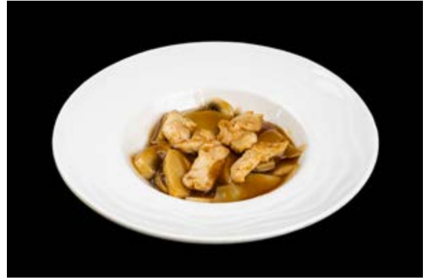
285. Pollo bambù e funghi € 7 (6)*