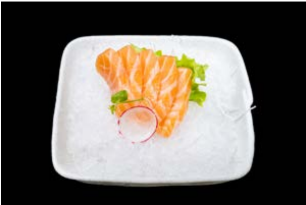
90. Sashimi di salmone € 12 (4)