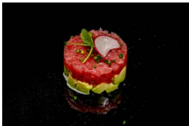
607. Tartare di tonno € 10 TONNO , OLIO EVO , PEPE NERO, AVOCADO (4)