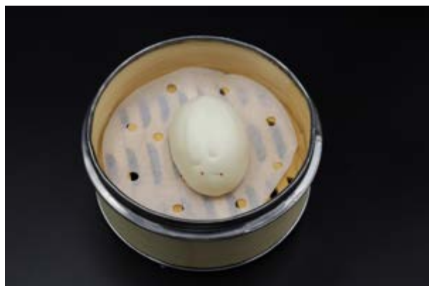
51. Bao dolce € 3 (1-7-15)*