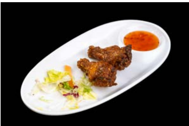
244. Alette di pollo € 5 (1)