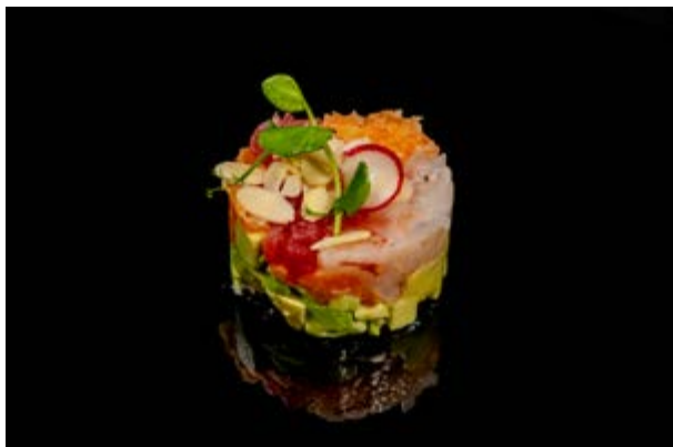
78. Tartare mista € 10 SALMONE, TONNO, GAMBERI , SALSA (2-4)