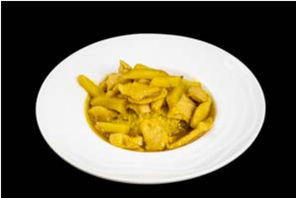
218. Curry Gohan € 8 (1)*