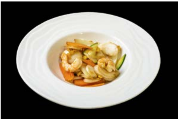
220. Gnocchi di riso con gamberi € 9 (2)*