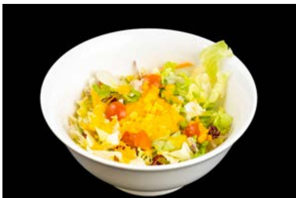
7. Insalata mista € 5 INSALATA VERDE MISTA (10)