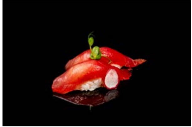
101. Nigiri tonno € 4 (4)