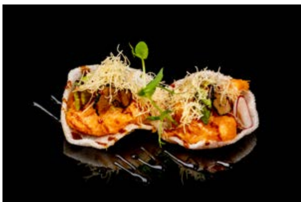
21. Nuvole di drago € 10 NUVOLA , TARTARA SALMONE , AVOCADO , TARTUFO ,KATAIFI , TERIYAKI (1-4-6-7)