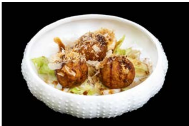
252. Takoyaki di polpo € 6 (1-14)*