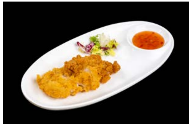
251. Suzuki Fry € 5 COTOLETTA DI PESCE BIANCO (1-3-4)*