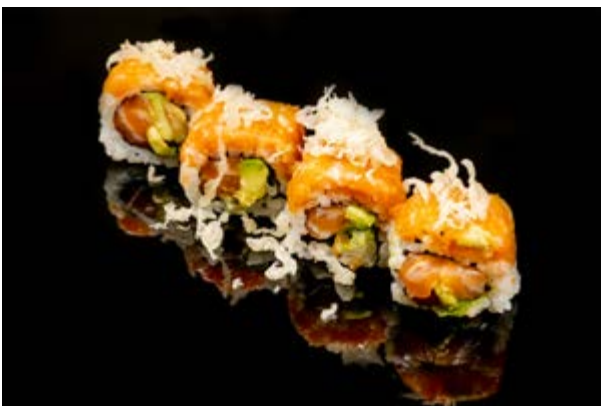
150. Salmon roll special € 12 4pz SALMONE AVOCADO , TARTARA DI SALMONE , BRICIOLE DI TEMPURA, TERIYAKI (1-4)