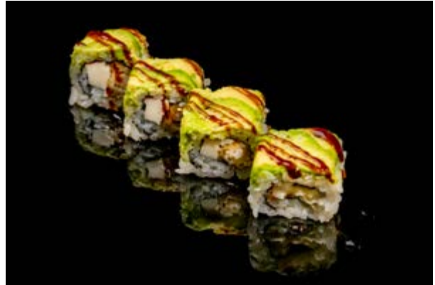
141. Dragon roll € 12 4pz GAMBERO IN TEMPURA ,SURIMI DI GRANCHIO , AVOCADO , PHILADELPHIA , TERIYAKI (1-2-6-7)*