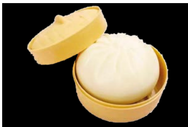
55. Bao al vapore ripieno € 3 1pz Bao al vapore ripieno con carne di maiale (1-7)*