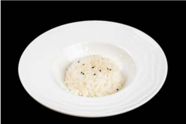
210. Riso bianco € 3