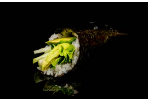
202. Temaki vegetariano € 5 AVOCADO INSALATA CETRIOLI (15)