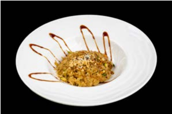
212. Riso con verdure € 7 RISO, VERDURE, SESAMO, ARACHIDI, SALSA MISO, TERIYAKI (3-6-8-11-15)