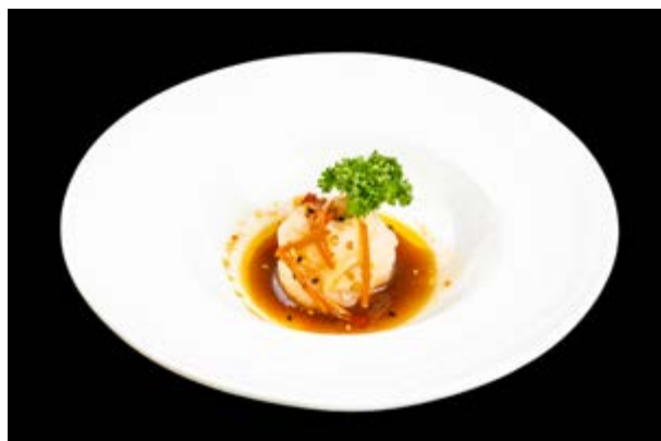
293. Pesce bianco al vapore € 8 ( massimo 1 volta a persona ) (4-6)*